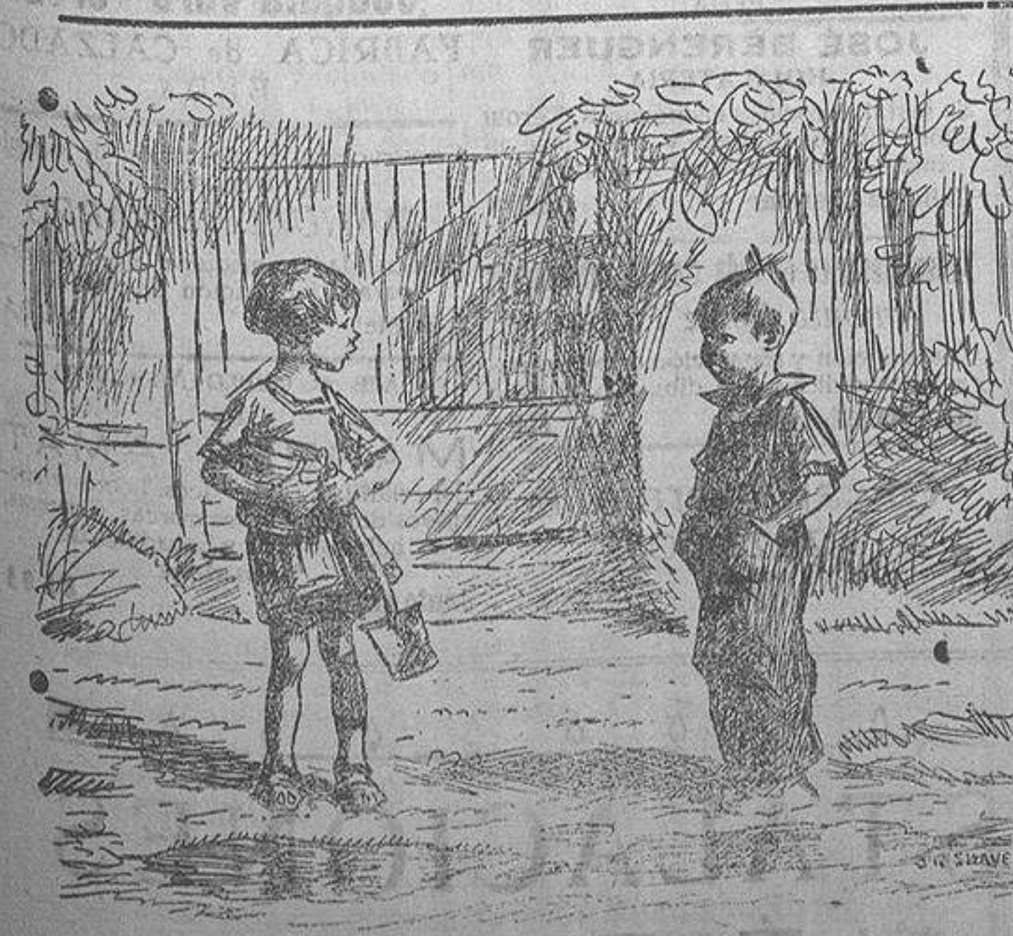
—Yo ya soy un hombre: llevo pantalón largo como papá. —¡Anda! Entonces mamá es una niña, porque lleva falda corta como yo.