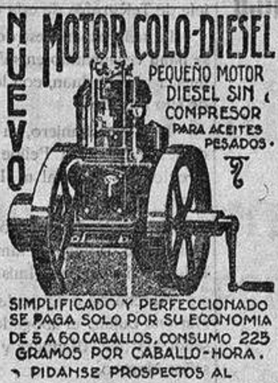
PEQUEÑO MOTOR DIESEL SIN COMPRESOR PARA ACETTES PESADOS.

RAYOS X Radioterapia.—Electroterapia.—Pototerapia.—Diatermia Alta frecuencia.—Tratamientos modernos ENFERMEDADES GENERALES, ESPECIALES INFANCIA Pecho.—Nutrición.—Reumatismo.—Piel Horas de consulta: De once de la mañana a dos de la tarde y de 3 a 5 TELEFONO, NUMERO, 24 Canalejas, 1, bao, derecha.—ALICANTE