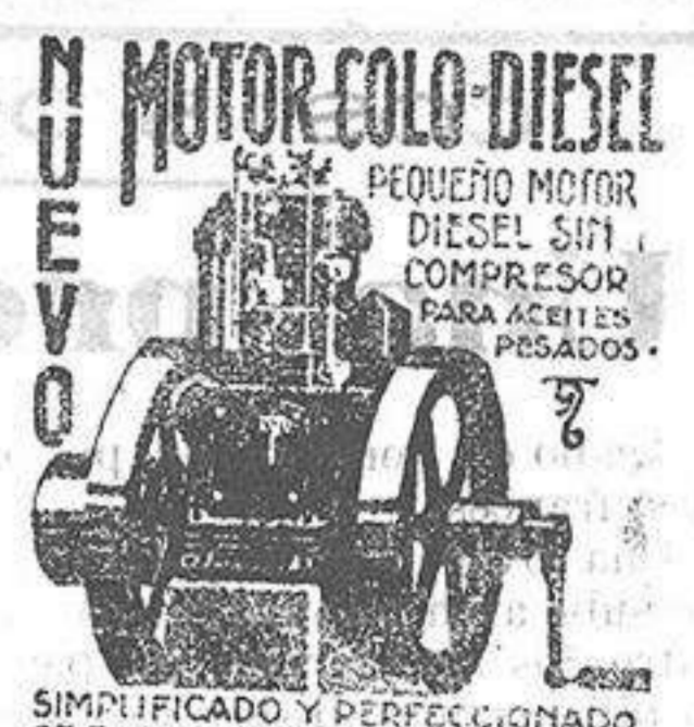
MOTOR COLO-DIESEL SIMPLIFICADO Y PERFECCIONADO SE PAGA SOLO POR SU ECONOMIA DE 5 A 60 CABALLOS, CONSUMO 225 GRAMOS POR CABALLO-HORA. PIDANSE PROSPECTOS AL Apartado 743—MADRID