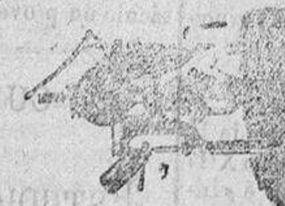
Máquina para hacer sacos