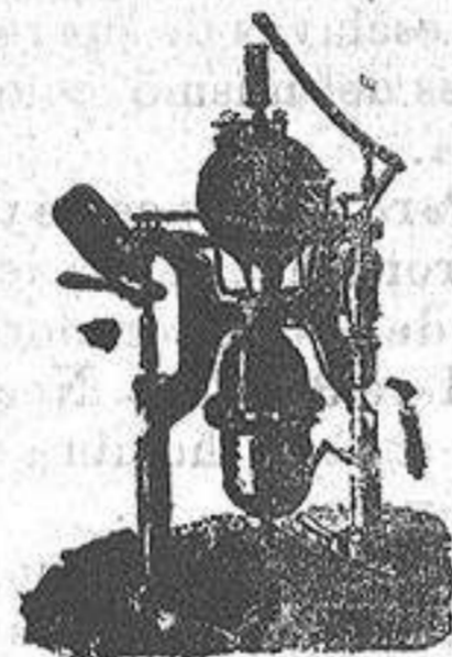
Máquina para hacer gaseosas