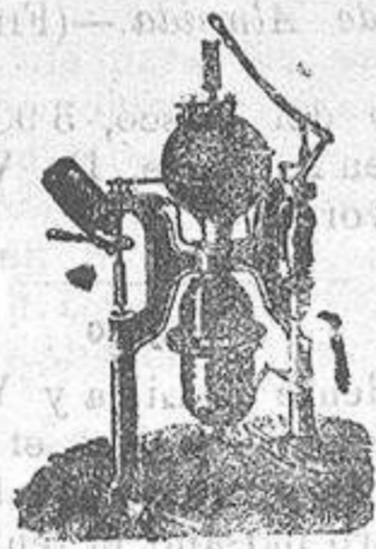
Máquina para gaseosas

Máquinas de vapor, Bombas, Presnas, Tubos de todas clases.