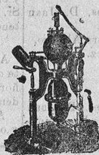
Máquina para hacer gaseosas