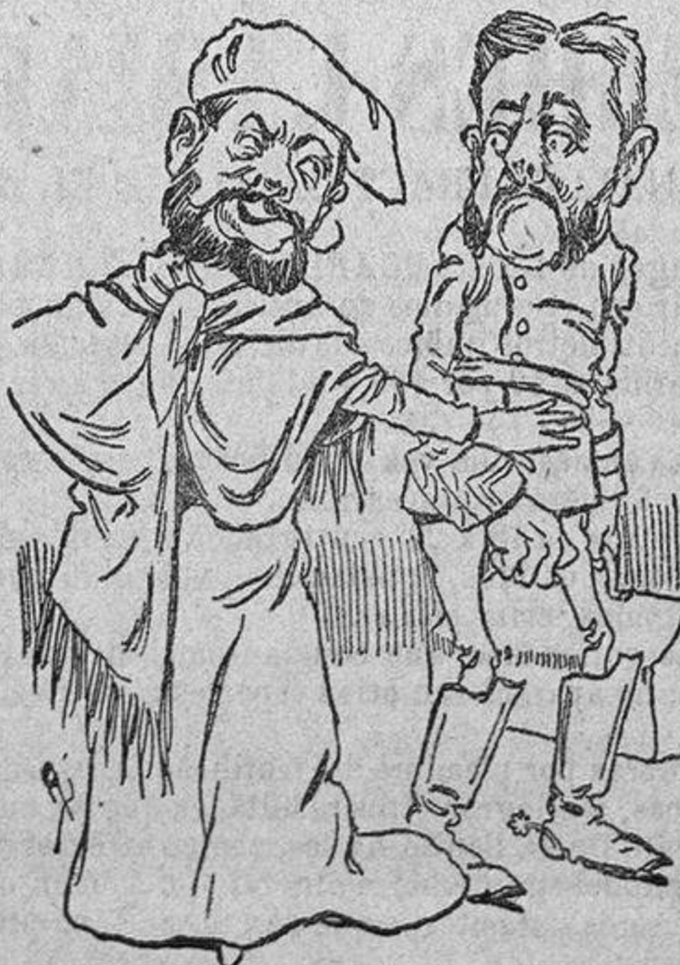
Cantar en acción

WEYLER.—Esta chiquilla está loca quiere que la quiera yo; ¡que la quiera su partido que tiene la obligación!