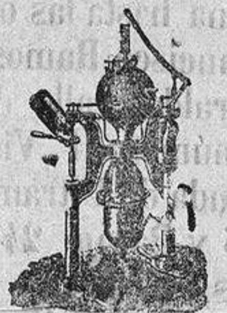
Aparatos para hacer gaseosas Intermitentes