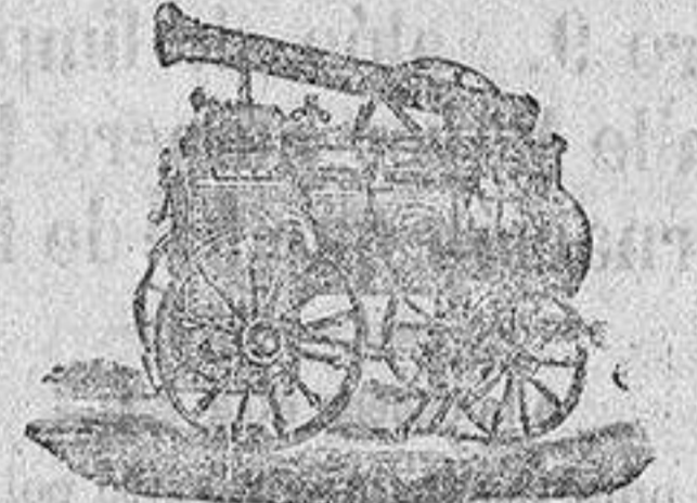
Máquina de vapor locomóvil

Catálogos gratis y franco quien los pida