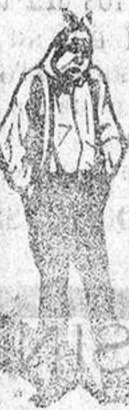
SE MANDADO POR AIBAF