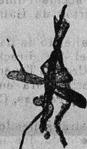
ANOFELE Mosquito que propaga la fiebre palúdica

Regamos á los señores Doctores, que lo ensayen en los casos que resultaron incurables con cualquier otro tratamiento, con la seguridad de que después no lo abandonarán nunca.