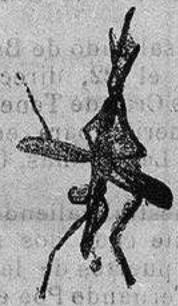
ANOFELLE Mosquito que propaga la fiebre palúdica