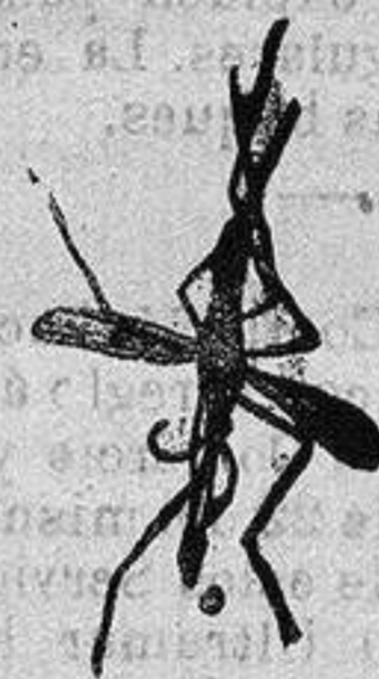
ANOFELE Mosquito que propaga la fiebre palúdica

Rogamos á los señores Doctores, que lo ensayen en los casos que resultaron incurables con cualquier otro tratamiento, con la seguridad de que después no lo abandonararán nunca.