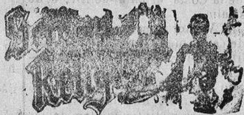
Santo de hoy: San Manuel Santo de mañana: San Macario

Para caballero hay un gran surtido en cortes de traje y pantalones, última creación, como también en abrigos, tanto en pieza, como confeccionados.