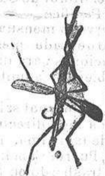
ANOFELE Mosquito que propaga la fiebre palúdica

Rogamos a los señores Doctores, que lo ensayen en los casos que resultaron incurables con cualquier otro tratamiento, con la seguridad de que después no lo abandonarán nunca.