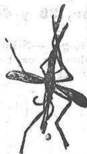
ANOFELE Mosquito que propaga la fiebre palúdica

Dosis curativa: 6 píldoras diarias por quince días. Dosis preventiva y reconstituyente: 2 píldoras diarias.