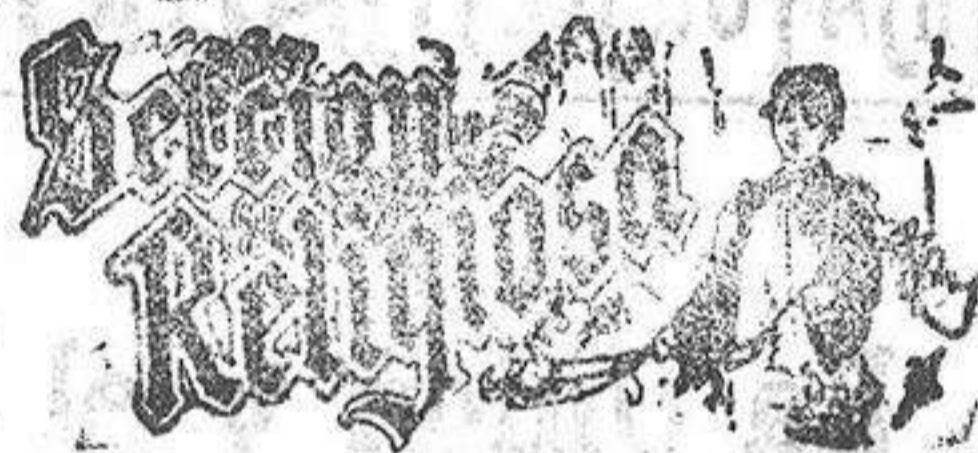
Santo de hoy: San Francisco Santo de mañana: San Felipe

Han dado principio los populares «Viernes» y «Sábado», con saldos, retales y gangas á la cuarta parte de su valor.