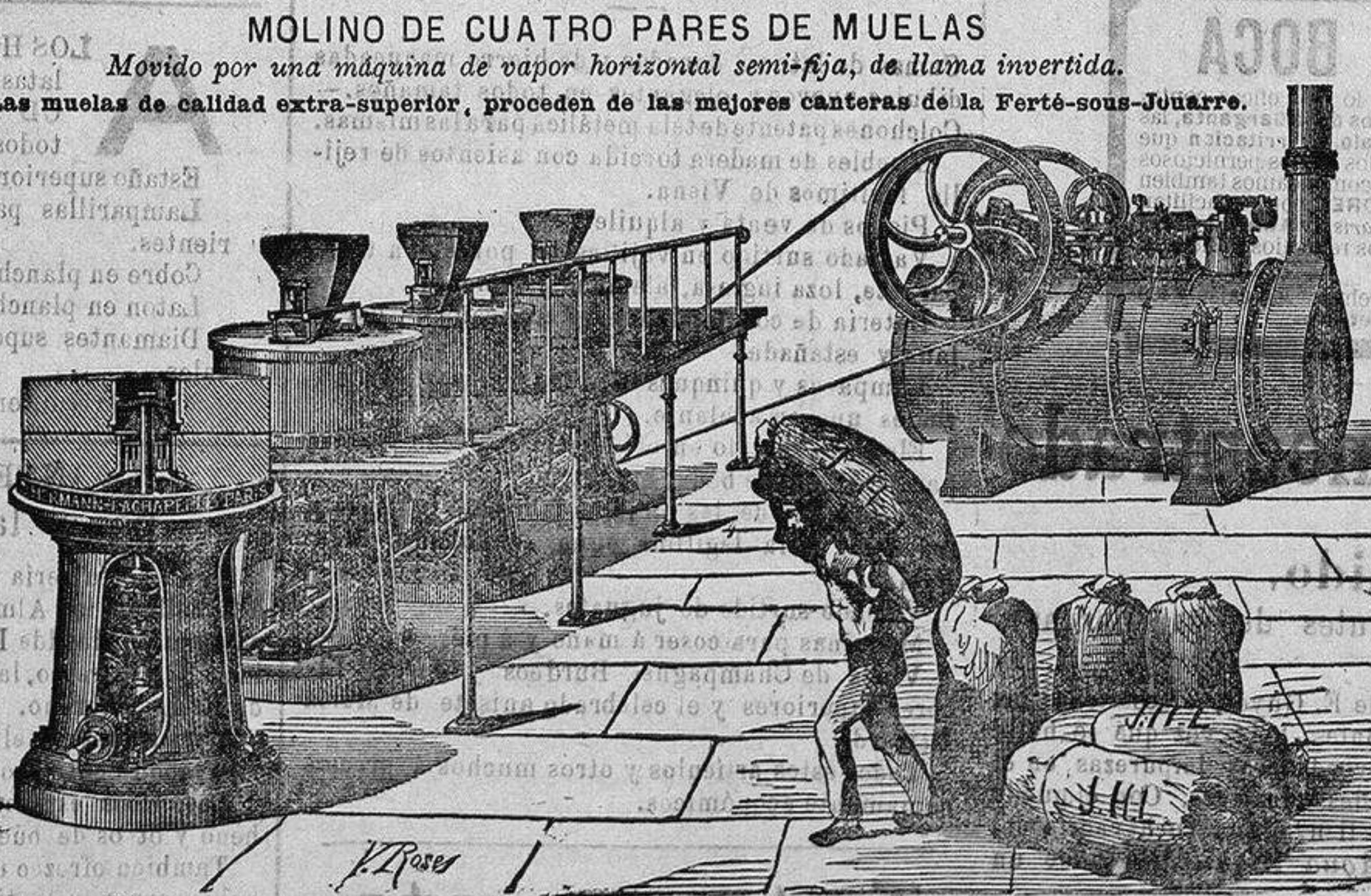
MOLINO DE CUATRO PARES DE MUELAS Movido por una máquina de vapor horizontal semi-fija, de llama invertida. Las muelas de calidad extra-superior, proceden de las mejores canteras de la Ferté-sous-Jouarre.

Esta lámina representa uno de los tipos mas completos y mas satisfactorios de instalaciones de molinos que la casa Hermann-Lachapelle de Paris construye para la molienda de cereales. Representa cuatro pares de muelas (el número de pares de muelas puede aumentarse á voluntad sin parar el trabajo y sin ningun genero de molestia), ó sea cuatro de estos ingeniosos molinos sobre columnas de fundicion que han valido una reputacion universal. Las ventajas que estos molinos ofrecen sobre todos los demás, son las siguientes: Solidez á toda prueba porqué el peso de la columna apoyandose en el suelo dá tal fuerza de asiento que el molino puede funcionar sin necesidad de armadura, mampostería ni auxilio de pernos.