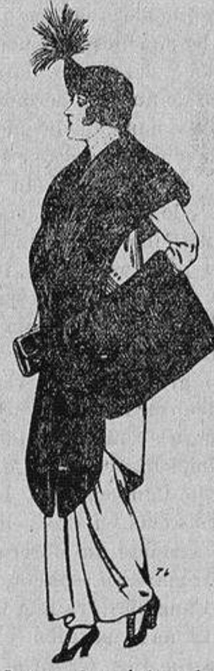
Juego de pieles de loutre de Nord para Señora 145 ptas.

Ropas confeccionadas para Caballero, Señora, Niño y Niña