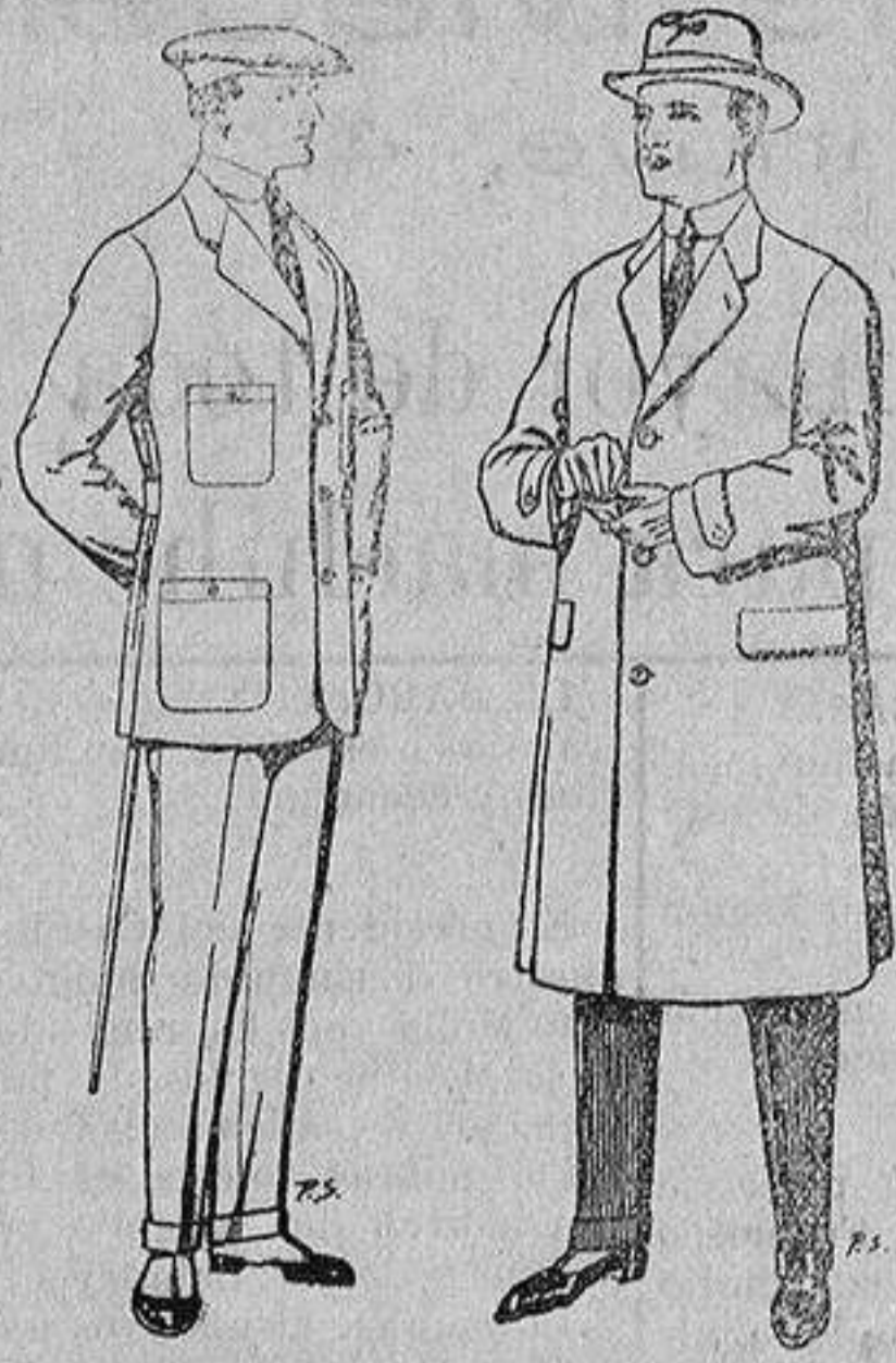
Trajes de cheviot, corte elegante para «Sportmen» De 45 a 55 ptas.

Madrid, Barcelona, Alicante, Almería, Bilbao, Cádiz, Cartagena, Gijón, Granada, Málaga, Palma de Mallorca, Santander, Sevilla, Valencia, Valladolid y Zaragoza