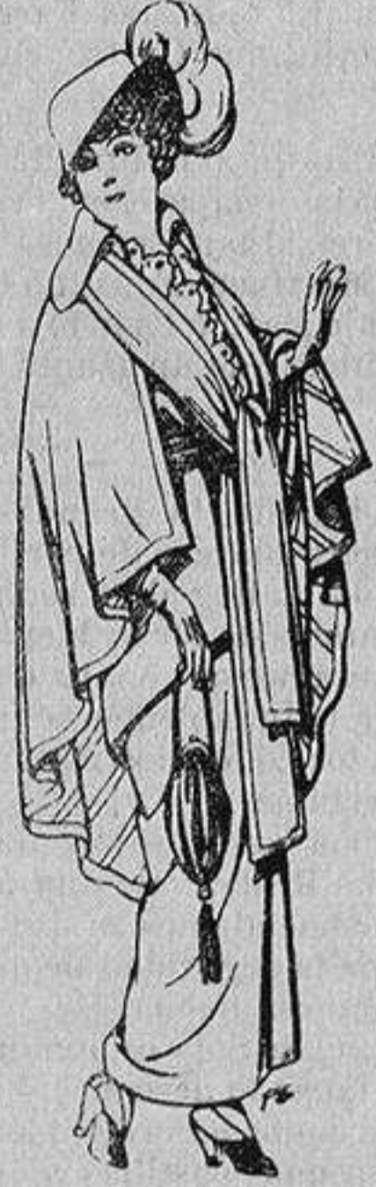
Capas de lana para señora A 20 ptas.

Ropas confeccionadas para Caballero, Señora, Niño y Niña