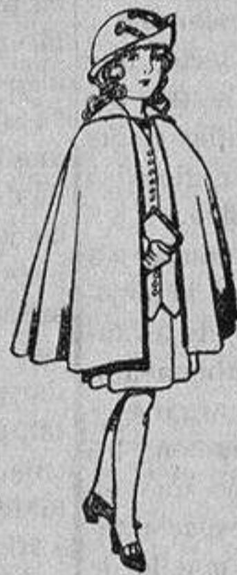
Capas de lana para niñas de 4 a 12 años De 20 a 22 ptas.