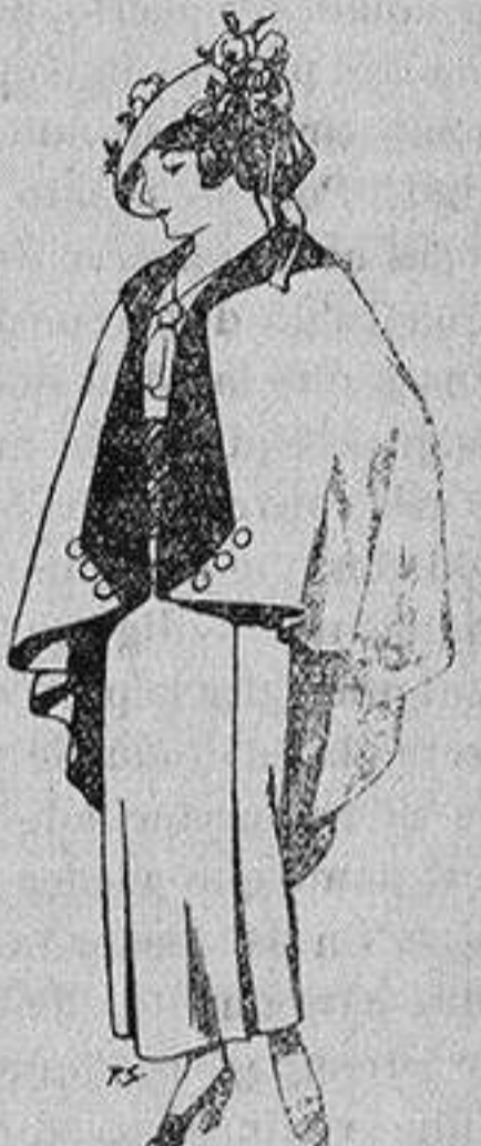
Capas de lana par jovencitas de 13 a 16 años A 25 pesetas

SECCIONES: Peletería, Camisería, Géneros de Punto, Corbatería, Guantería, Sombrerería, Zapatería, Paraguas, Bastones y Artículos de Viaje.