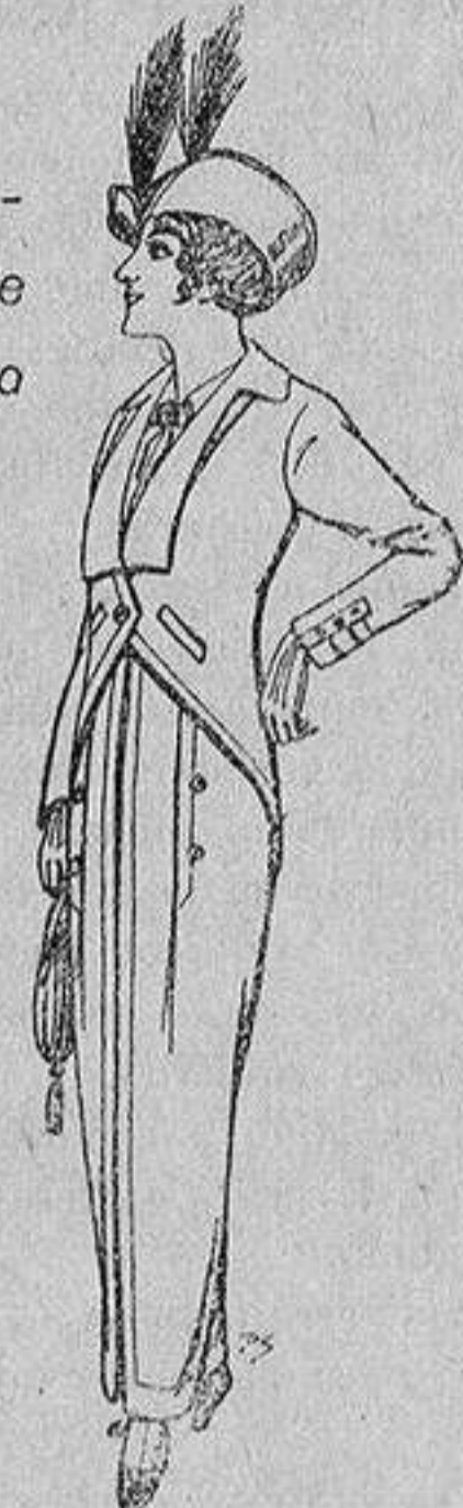
Trajes jerga negra para Señora 65 ptas.