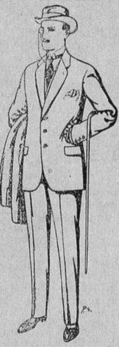
Trajes de patén, cheviot, etc. De 17'50 a 70 ptas.