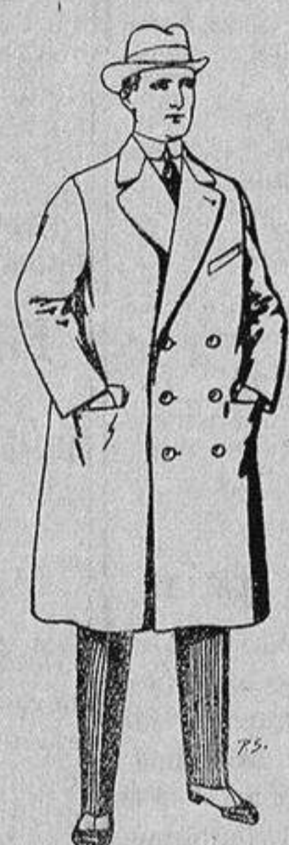
Gabanes de patén y cheviot 55 a 105 ptas.