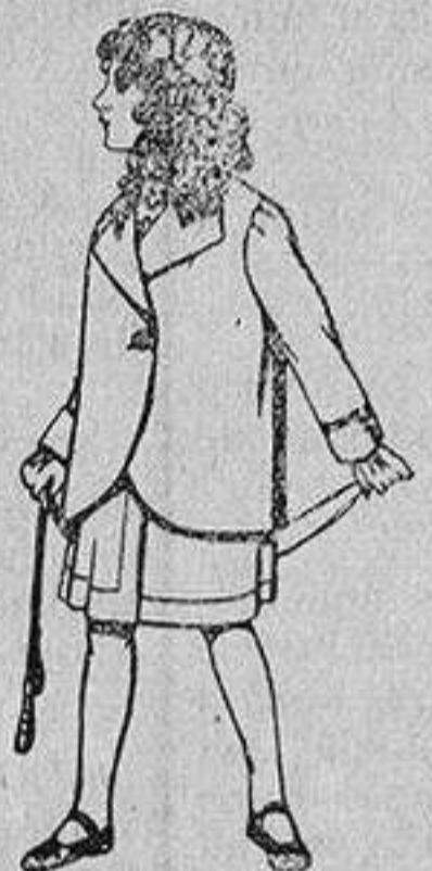
Trajes de lanilla para niños de 4 a 12 años De 14 a 22 ptas.