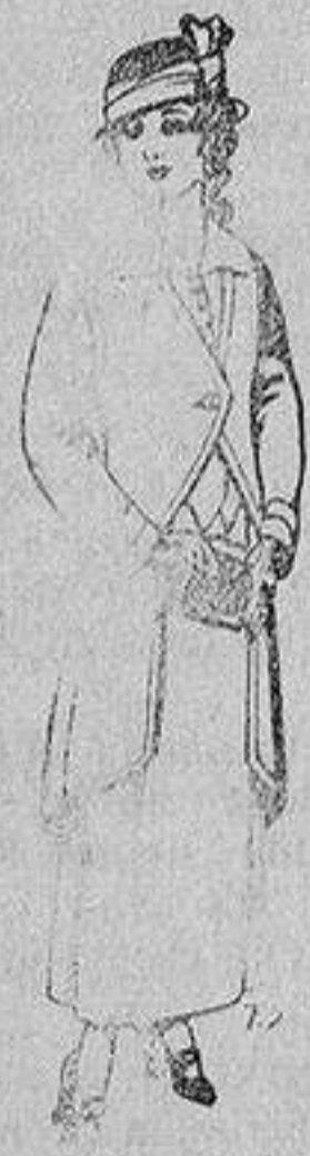
Trajes de lanilla para jovencitas de 13 a 16 años De 40 a 45 ptas.