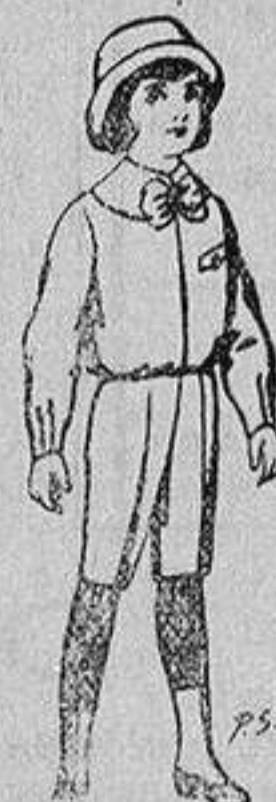
Trajes patén para niños de 4 a 9 años De 5 a 5'50 ptas.