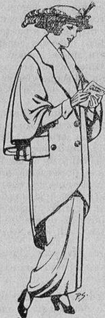
Abrigos de patén para Señora De 55 a 65 ptas.