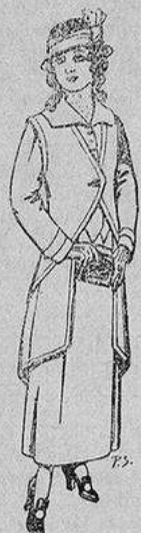
Trajes de lanilla para jovencitas de 13 a 16 años De 40 a 45 ptas.