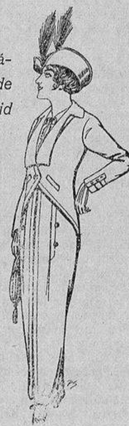
Trajes jerga negra para Señora 65 ptas.