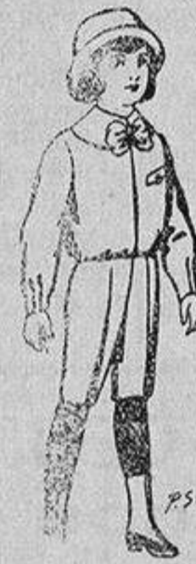
Trajes patén para niños de 4 a 9 años De 5 a 5'50 ptas.