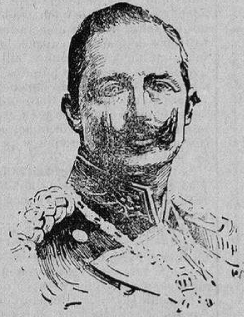
El emperador Guillermo

¡Ay! del vencido, sí, pero ¡ay! también de los vencedores, que pagarán caro, muy caro, el precio de la victoria.