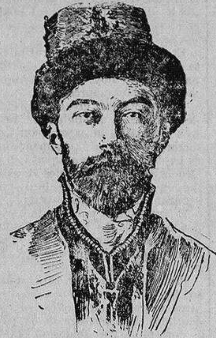
El zar Nicolás

gradas por el hombre en su lucha tenaz y titánica en pro de su redención; pero aún hoy, como hace siglos, la felicidad de uno o varios pueblos han dependido de la imprudencia o de la ambición de un hombre.