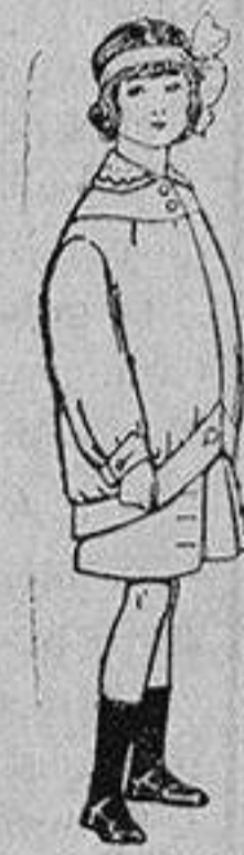
Trajes de lanilla para niños de 4 a 12 años De Ptas. 20 a 30

PRECIO FIJO y VENTAS AL CONTADO PIDASE EL CATALOGO GENERAL