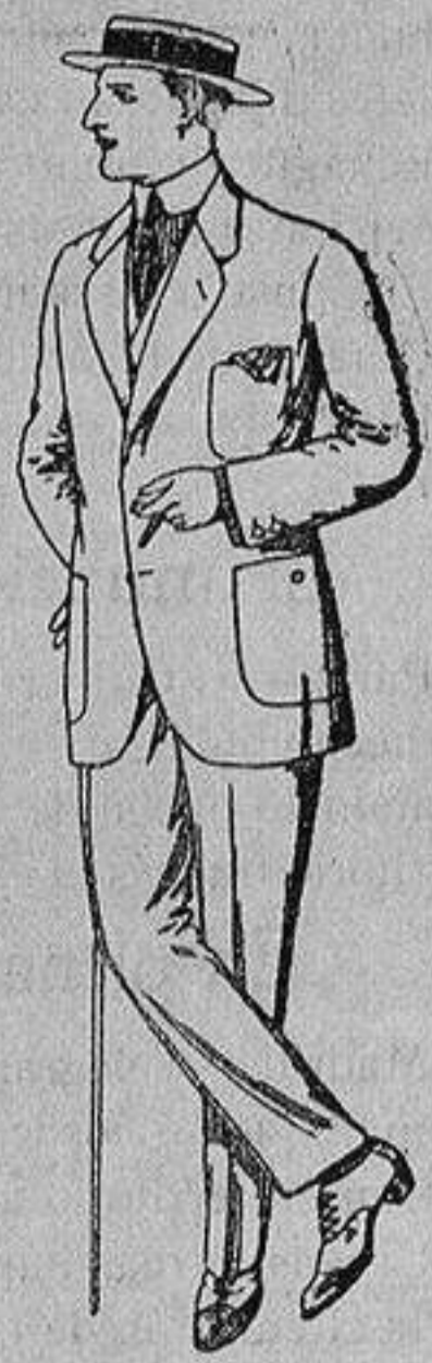
Trajes de dril crudo kaki o listado De Ptas. 10 a 32

Madrid, Barcelona, Alicante, Almería, Bilbao, Cádiz, Cartagena, Gijón, Granada, Málaga, Palma de Mallorca, Santander, - Sevilla, Valencia, Valladolid y Zaragoza -