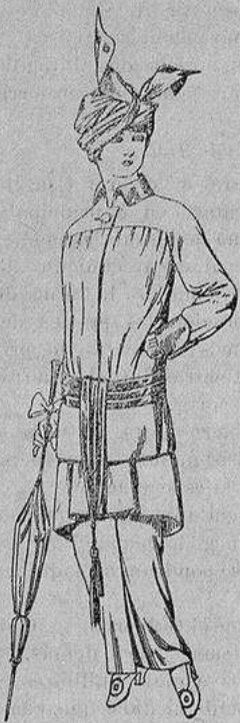
Traje de jerga azul o negra y géneros novedad, para señora De Ptas. 65 a 80