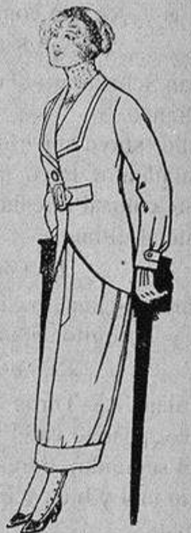
Trajes de lanilla para jovencitas de 13 a 16 años A Ptas. 27