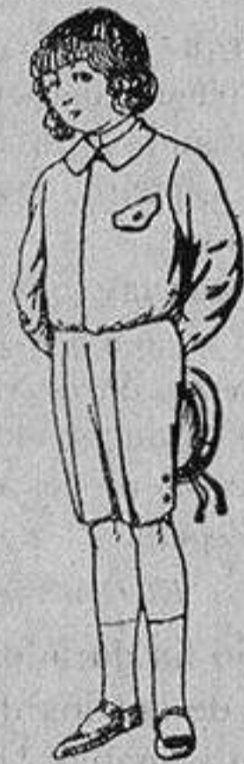
Trajes de lanilla, vicuña o jerga, para niños de 4 a 9 años De Ptas. 5 a 10