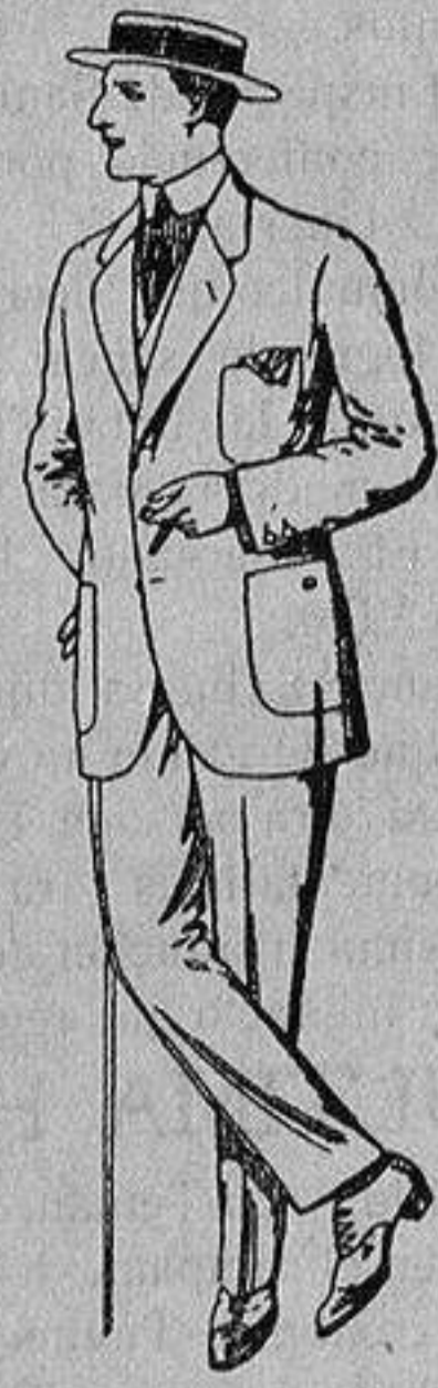
Trajes de dril crudo kaki o listado De Ptas. 10 a 32

Madrid, Barcelona, Alicante, Almería, Bilbao, Gádiz, Cartagena, Gijón, Granada, Málaga, Palma de Mallorca, Santander, - Sevilla, Valencia, Valladolid y Zaragoza -