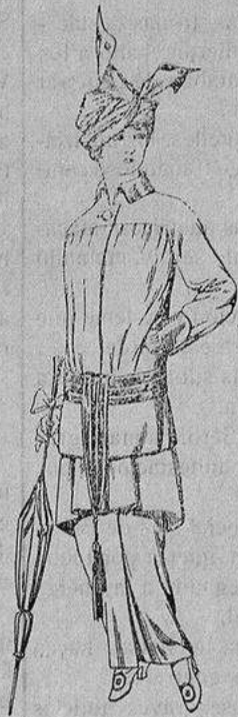
Traje de jerga azul o negra y géneros novedad, para señora De Ptas. 65 a 80