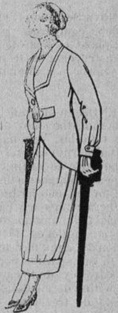
Trajes de lanilla para jovencitas de 13 a 16 años A Ptas. 27