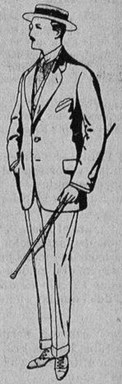
Trajes de alpaca uagra De Ptas. 32 a 56