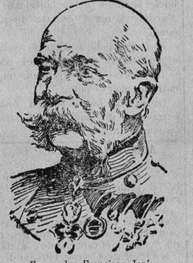
Emperador Francisco José

desarrollar la política de energía que a sus intereses conviene llevar a los Balcanes. Se teme que la afección pulmonar que padece Francisco José acabe con la vida de éste antes del próximo invierno, lo cual retrasaría algunos años los aludidos planes expansionistas, porque los primeros años del nuevo reinado habría que consagrarlos a reponerla de los posibles quebrantos que había de sufrir en la muerte del anciano emperador. Pero es de creer que éste dado su carácter pacífico y bondadoso, no habría de interponer