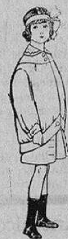
Trajes de lanilla para niños de 4 a 12 años De Ptas. 20 a 30

SECCIONES: Camisería, Géneros de Punto, Corbatería, Guantería, Sombrerería, Zapatería, Paraguas, Bastones y Artículos para Viaje.