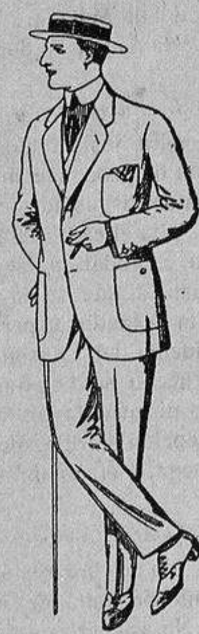
Trajes de dril crudo kaki o listado De Ptas. 10 a 32

Madrid, Barcelona, Alicante, Almería, Bilbao, Cádiz, Cartagena, Gijón, Granada, Málaga, Palma de Mallorca, Santander, - Sevilla, Valencia Valladolid y Zaragoza -