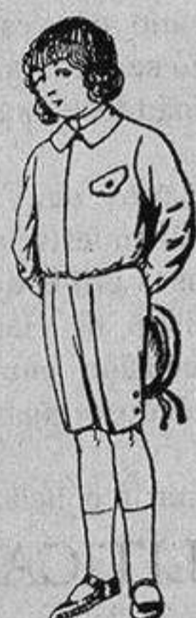
Trajes de lanilla, vicuña o jerga, para niños de 4 a 9 años De Ptas. 5 a 10