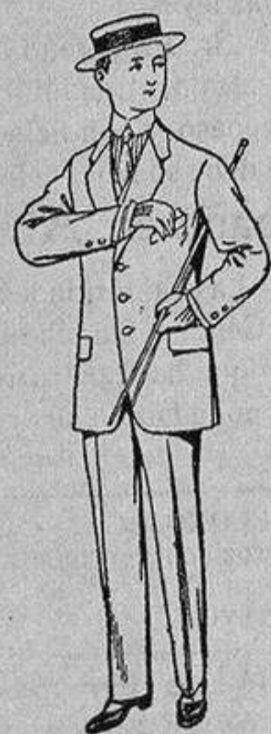
Trajes de nanilla vicuña, etc., para niños de 10 a 15 años De Ptas. 14 a 48