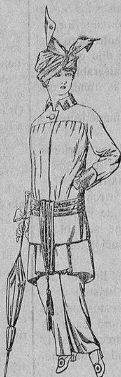
Traje de jerga azul o negra y géneros novedad, para señora De Ptas. 65 a 80