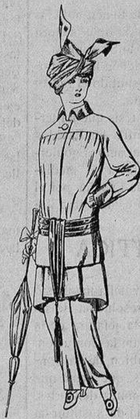
Traje de jerga azul o negra y géneros novedad, para señora De Ptas. 65 a 80