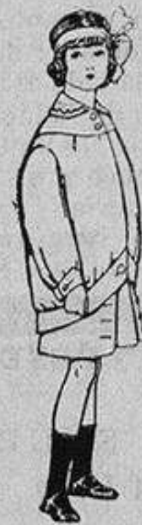
Trajes de lanilla para niños de 4 a 12 años De Ptas. 20 a 30

PRECIO FIJO y VENTAS AL CONTADO PIDASE EL CATALOGO GENERAL