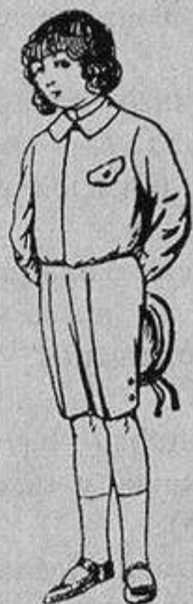
Trajes de lanilla, vicuña o jerga, para niños de 4 a 9 años De Ptas. 5 a 10