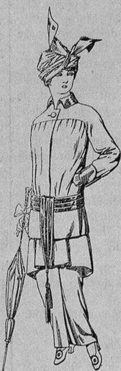
Traje de jerga azul o negra y géneros novedad, para señora De Ptas. 65 a 80