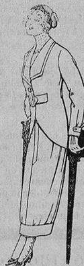
Trajes de lanilla para jovencitas de 13 a 16 años A Ptas. 27

Para curar rápidamente las BLENORRAGIAS más rebeldes Tómesese