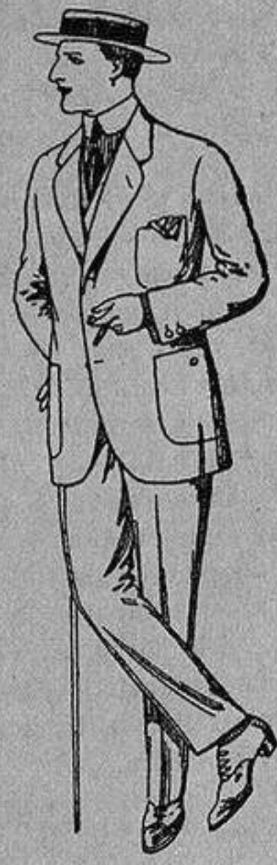
Trajes de dril crudo kaki o listado De Ptas. 10 a 32

Madrid, Barcelona, Alicante, Almería, Bilbao, Cádiz, Cartagena, Gijón, Granada, Málaga, Palma de Mallorca, Santander, - Sevilla, Valencia, Valladolid y Zaragoza -