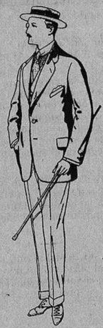
Trajes de alpaca uoera De Ptas. 32 a 56