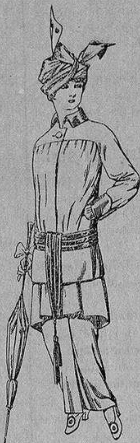
Traje de jerga azul o negra y géneros novedad, para señora De Ptas. 65 a 80