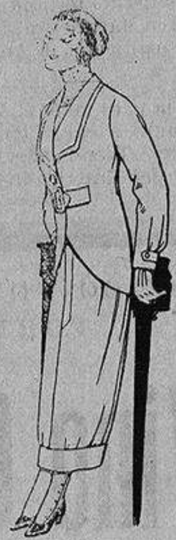
Trajes de lanilla para jovencitas de 13 a 16 años A Ptas, 27