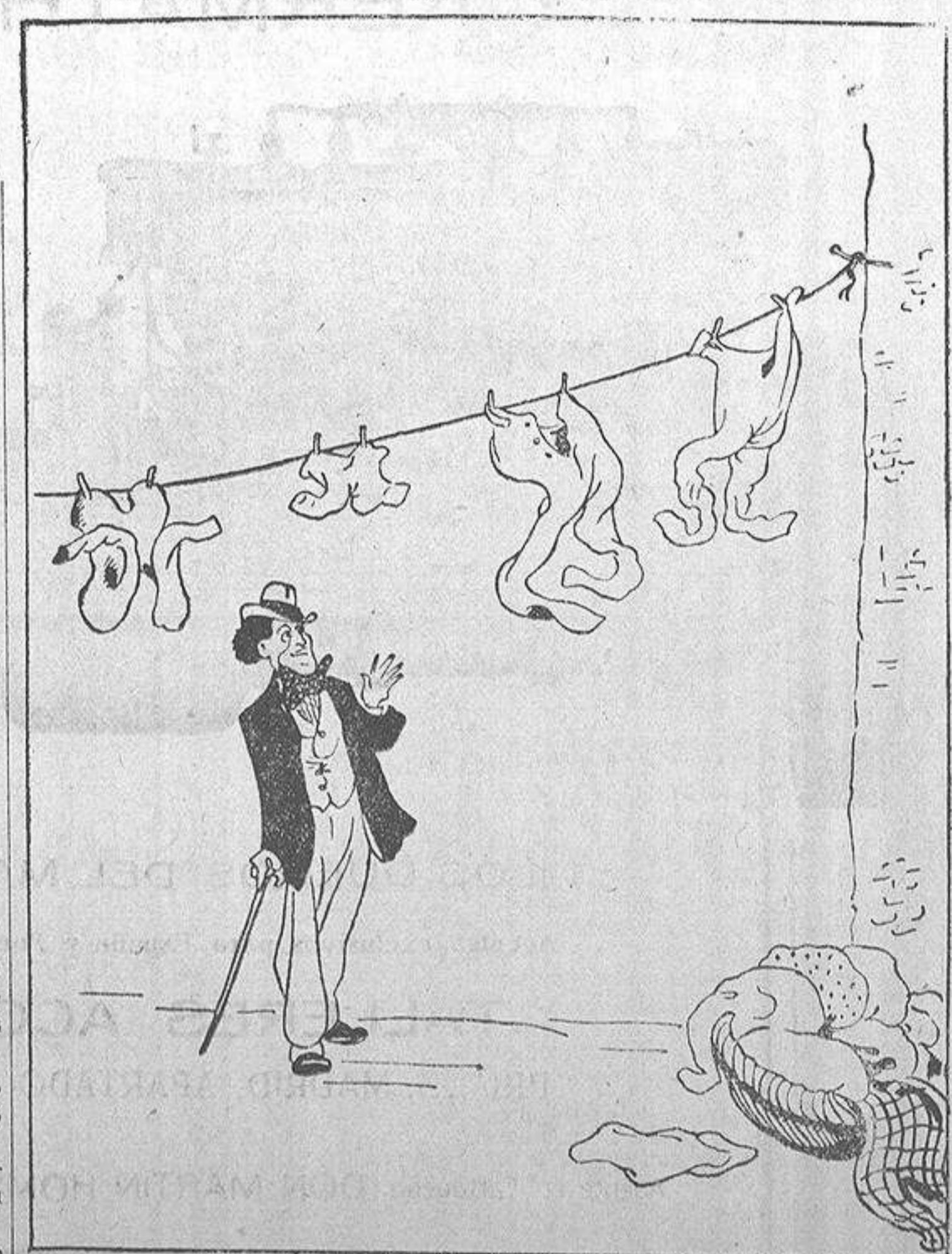
Uno de los primeros roperos que existieron en el mundo.

Los aviadores han celebrado hoy la fiesta de su Patrona, Santa Loreto, con un acto religioso que se ha visto muy concurrido.