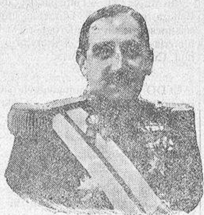
El general gobernador militar don Manuel Montero a quien se debe la mejora esta

La Prensa unánimemente tuvo sus más acerbas censuras siempre contra esa