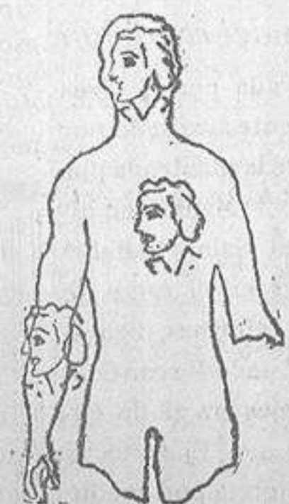
El biógrafo de Alfieri en estado de llaga. Cuando ya no es el sino el biografiado. El cuerpo vive en el cuerpo sangriento del biógrafo.

se pinta o describe. Y no «decidirse» luego, cobardemente) El Cristo de Papini seduce y atrae: es fuego sagrado de amor y pasión. Hacer historia, pues, no es ciertamente hacer números. Y no me arguya el pedante con eso de la poesía de la cifra, del calor frío del signo, de la pasión mesurada y mensurada, hegeliana, «desapasionada». A veces digo y repito en delicadas conversaciones amistosas, a propósito del magnífico poeta Jorge Guillén, que merecía ser «profesor honorario de matemáticas» (de «divinas matemáticas»), un Góngora pitagórico y euclidiano: problemático. Con esto quiero significar rotundamente que pasión, no es antinúmero (precisión, medida, armonía); solo; antiaridez, frialdad, escasez de sensibilidad distinguida, egrégia.