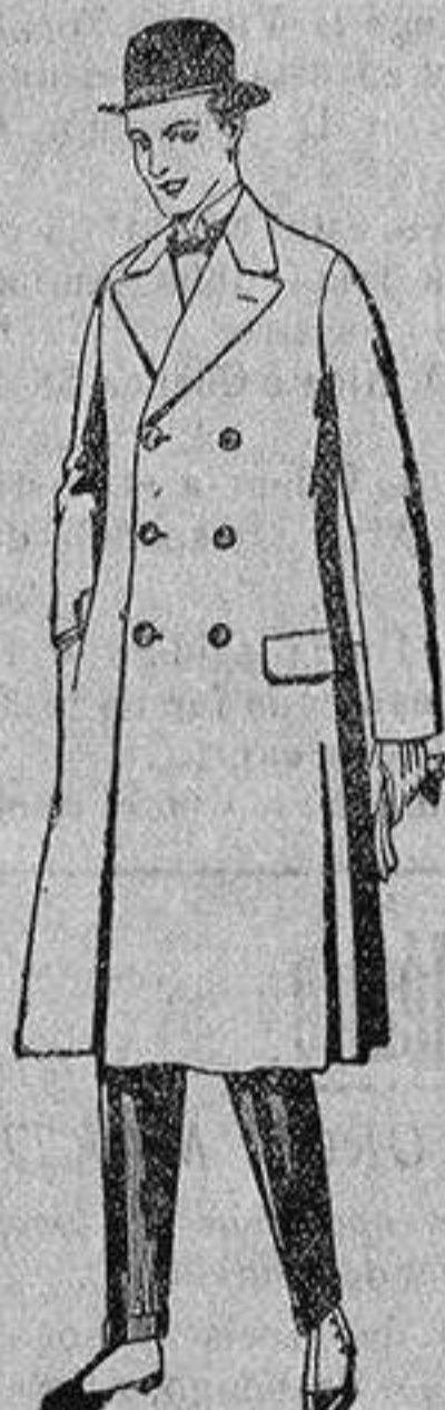
Gabanes de patén, gamuza o Cowar, de pesetas 50 a 110.