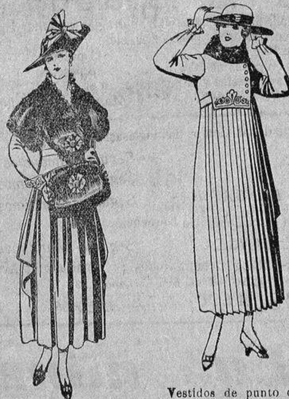
Juegos de pieles, negro, imitación Renard. Gran chic, a ptas. 58.