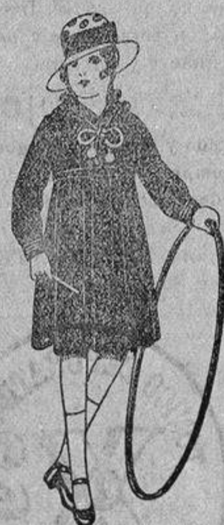
Vestidos marinera, de sarga o estambre azul, adornos seda blancos, de ptas. 25 a 30.