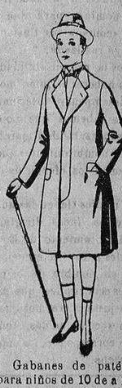
Gabanes de patén para niños de 10 de a 12 años, de ptas. 18 a 55. Los mismos, para juveniles de 13 a 16 años de ptas. 21 a 58.

PRECIO FIJO - VENTAS AL CONTADO - Pídase el Catálogo general