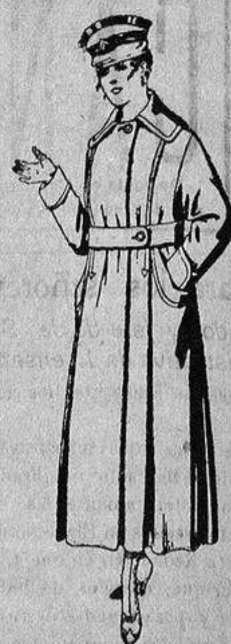
Abrigos do cheviot o gamuza, en azul, negro y colores, de ptas. 45 a 55.