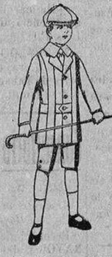
Trajes de patén, modelo « Norfolk », para niños de 4 a 9 años, de ptas. 14 a 35.