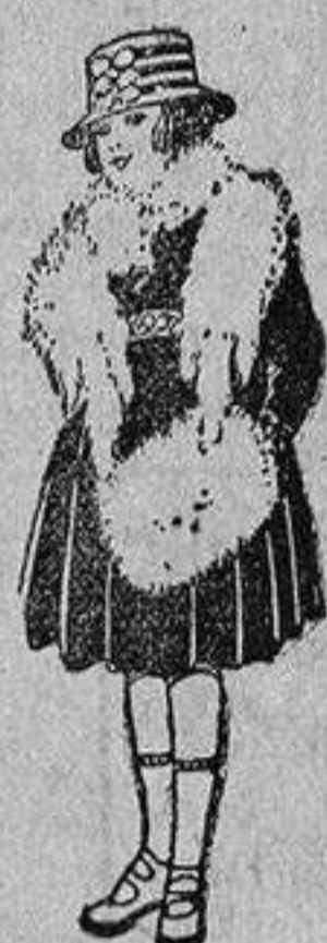
Juegos imitación Renard, blanco, a ptas. 12.