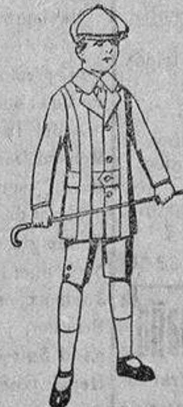
Trajes de patén, modelo «Norfolk», para niños de 4 a 9 años, de ptas. 14 a 35.