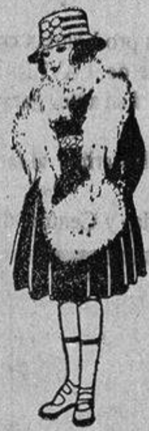
Juegos imitación Renard, blanco, a ptas. 12.