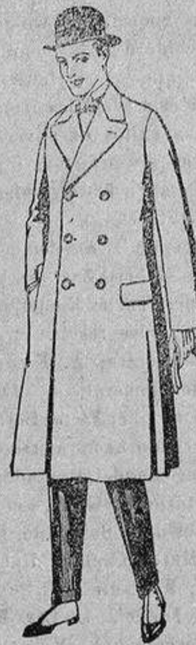
Gabanes de patén gamuza o Cowar, de pesetas 50 a 110.

Gamisería - Géneros de punto Corbatería - Guantería Sembrería - Zapatería Paraguas - Bastones y artículos - - - de viaje - - -