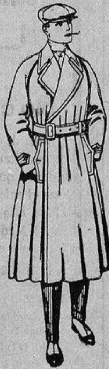
Gabanes impermeabilizados, con cinturón, color beige, de ptas. 48 a 115.

ROPAS CONFECCIONADAS PARA CABALLERO, - Señora, niño y niña -