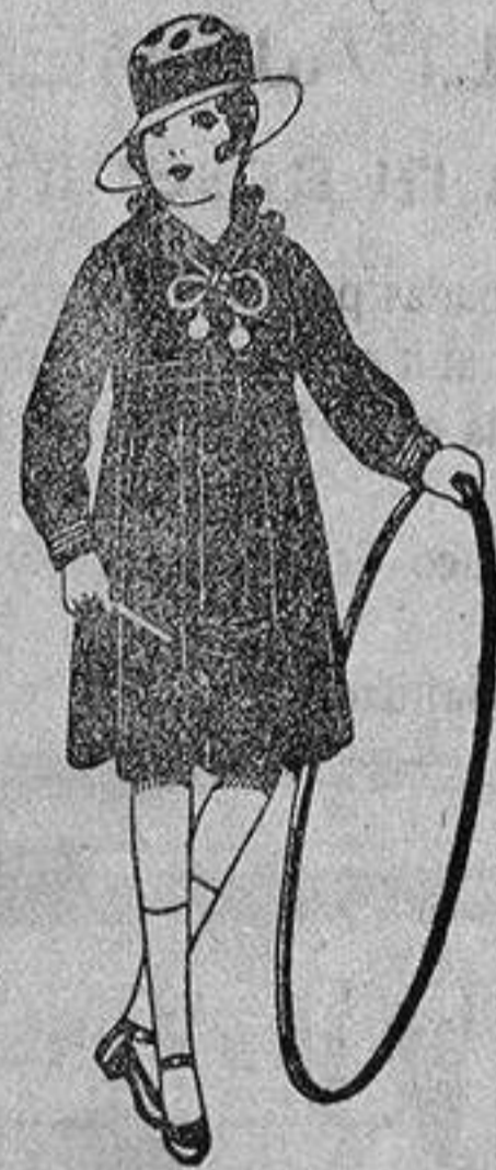
Vestidos marinera, de sarga o estambre azul, adornos seda blancos, de ptas. 25 a 30.