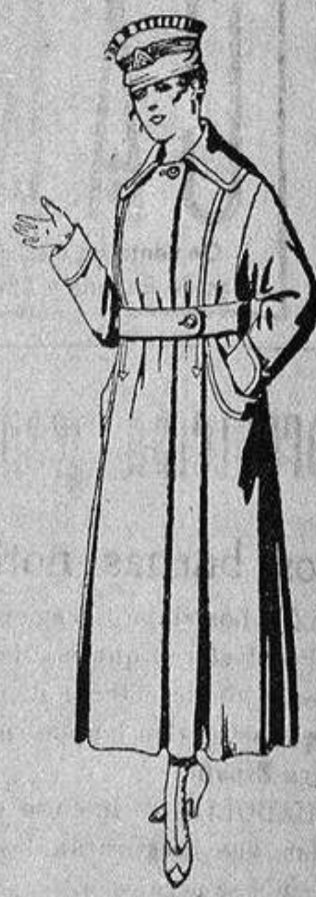
Abrigos de cheviot o gamuza, en azul, negro y colores, de ptas. 45 a 55.