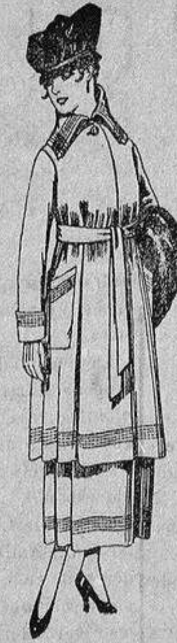
Trajes de sarga inglesa, en negro y azul, bordados, de ptas. 85 a 100.

Madrid, Barcelona, Alicante, Almería, Bilbao, Cádiz, Cartagena, Gijón, Granada, Málaga, Palma de Mallorca, Santander, Sevilla, Valencia, Valladolid y Zaragoza.