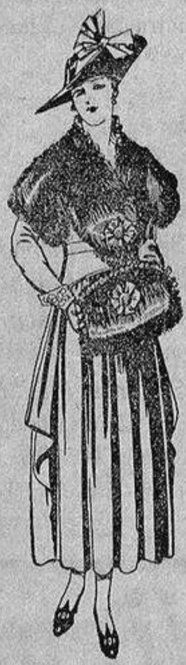
Juegos de pieles, negro, imitación Renard. Gran chic, a ptas. 58.