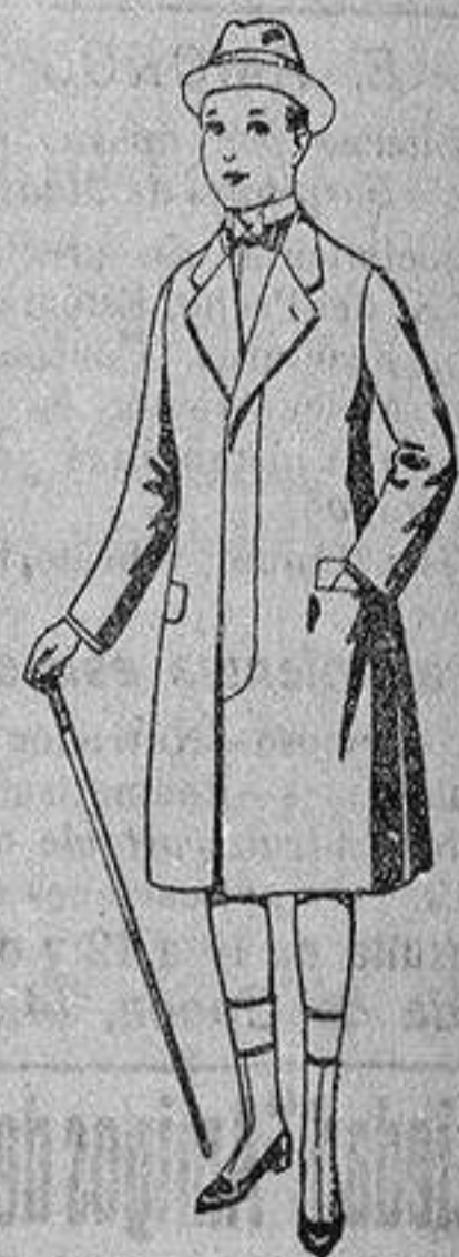
Gabanes de patén para niños de 10 de a 12 años, de ptas. 18 a 55. Los mismos, para jóvenes de 13 a 16 años de ptas. 21 a 58.

- PRECIO FIJO - VENTAS AL CONTADO - Pídase el Catálogo general -