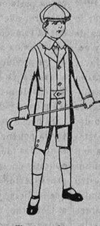
Trajes de patén, modelo « Norfolk », para niños de 4 a 9 años, de ptas. 14 a 35.