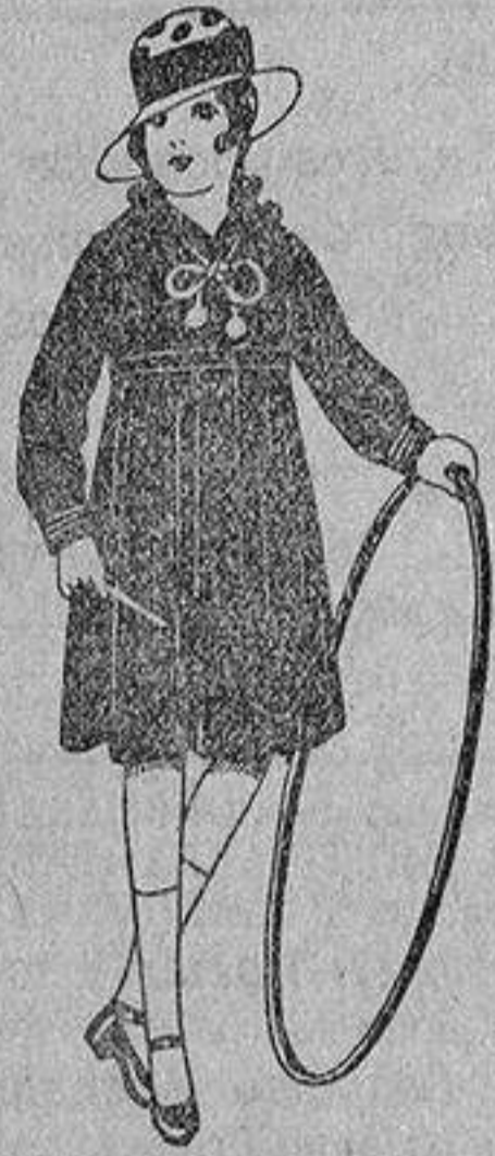
Vestidos marinera, de sarga o estambre azul, adornos seda blancos, de ptas. 25 a 30.