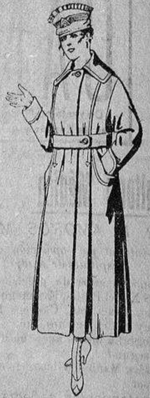
Abrigos de cheviot o gamuza, en azul, negro y colores, de ptas. 45 a 55.