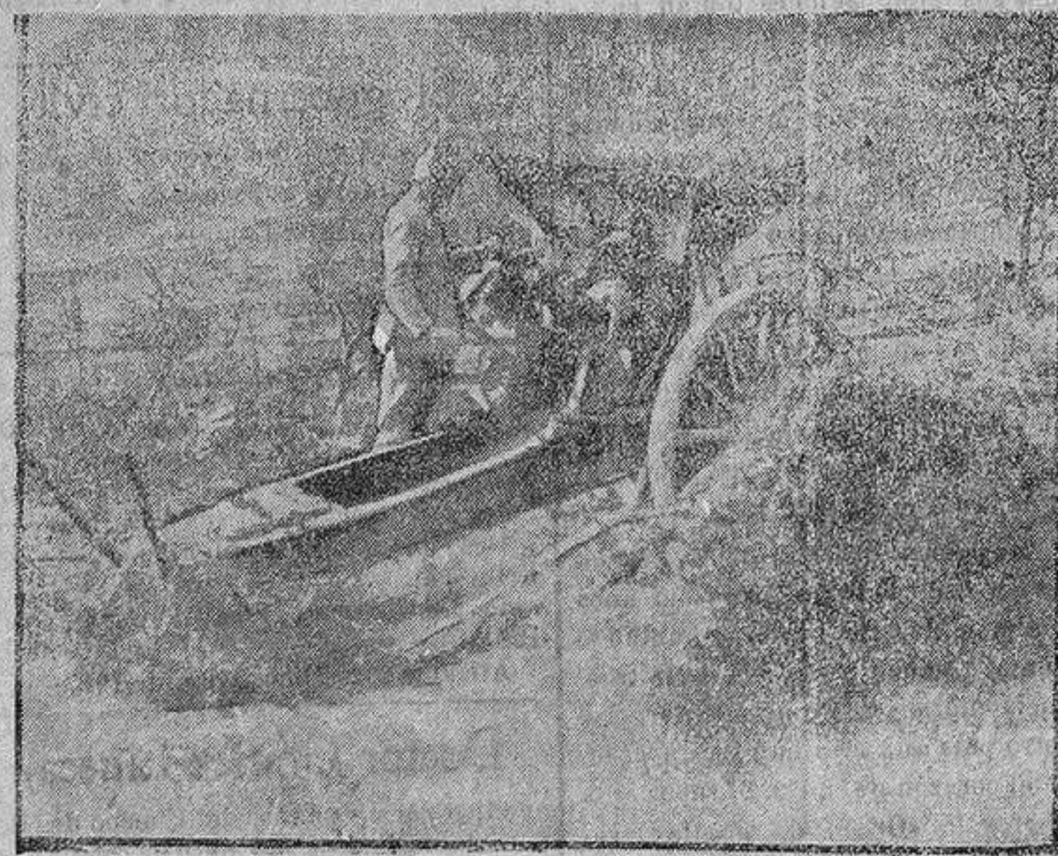
Cañón alemán de 105 capturado y utilizado por los franceses contra sus enemigos