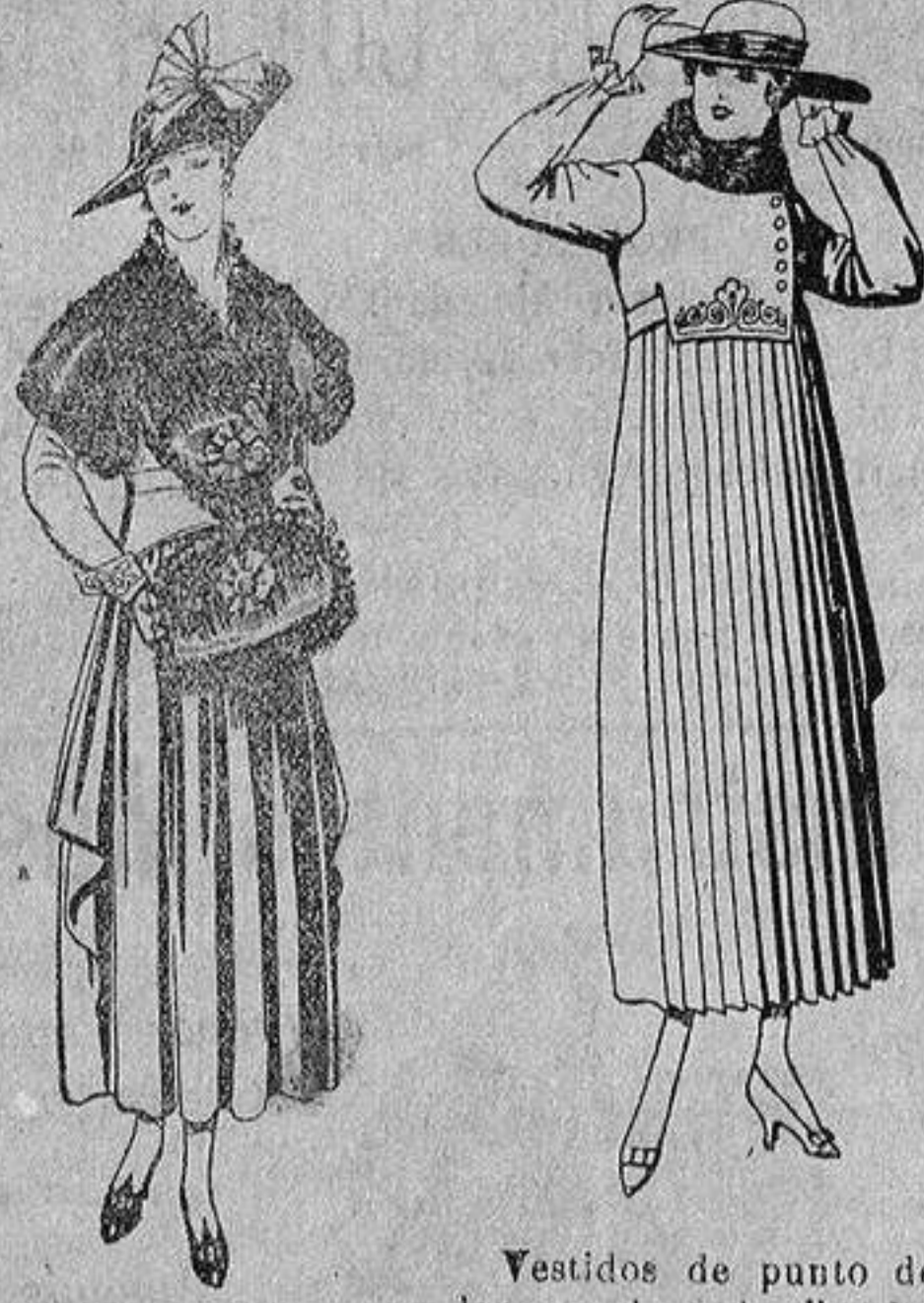
Juegos de pieles, negro, imitación Renard. Gran chic, a ptas. 58.

Madrid, Barcelona, Alicante, Almería, Bilbao, Cádiz, Cartagena, Gijón, Granada, Málaga, Palma de Mallorca, Santander, Sevilla, Valencia, Valladolid y Zaragoza.