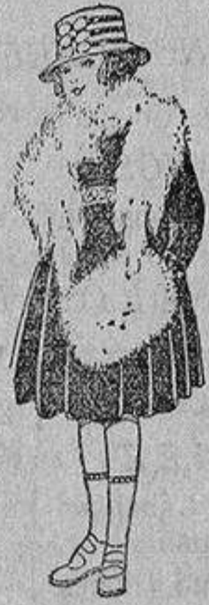
Juegos imitación Renard, blanco, a ptas. 12.