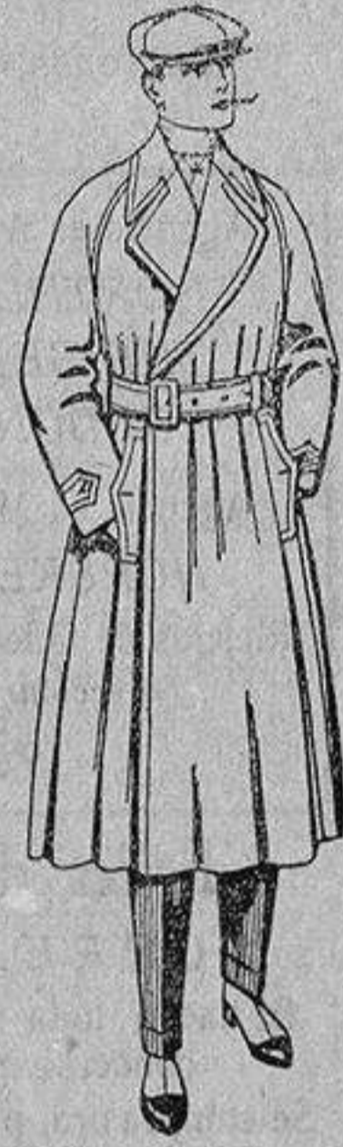
Gabanes impermeabilizados, con cinturón, color beige, de ptas. 43 a 115.

ROPAS CONFECCIONADAS PARA CABALLERO, - Señora, niño y niña -