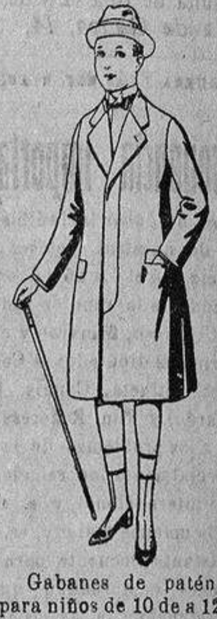
Gabanes de patén para niños de 10 de a 12 años, de ptas. 18 a 55. Los mismos, para jóvenes de 13 a 16 años de ptas. 21 a 58.

PRECIO FIJO - VENTAS AL CONTADO - Pídase el Catálogo general