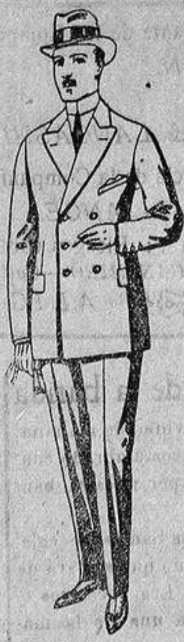
Trajes de creviot, melton, etc., de ptas. 25 a 85. Los mismos en vicuña o jerga, de 22 a 90.