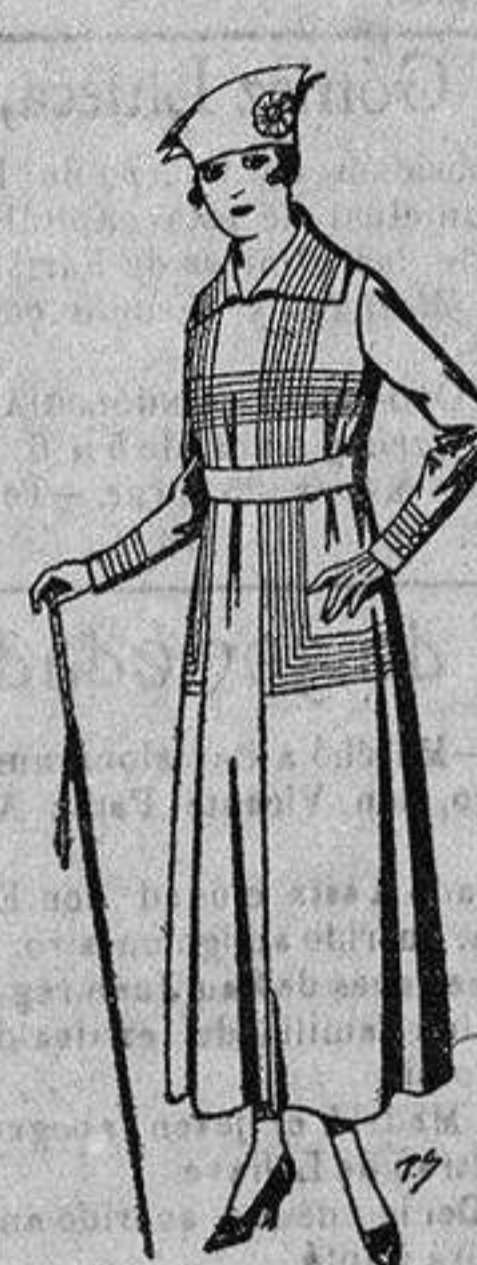
Vestidos de gabardina, es-tambre, en negro, azul y color borbuados, de ptas. 60 a 68.