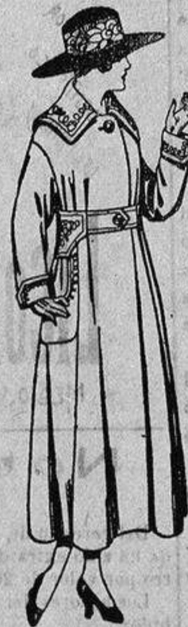
Abrigos de gabardina, pañete, etc., en azul y color bordados, de ptas. 75 a 95.