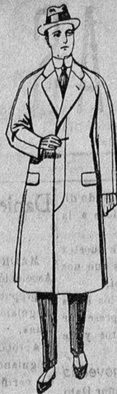
Gabanes de patén, melton o cheviot, con forro de seda, satén o esocés, de ptas. 50 a 100.