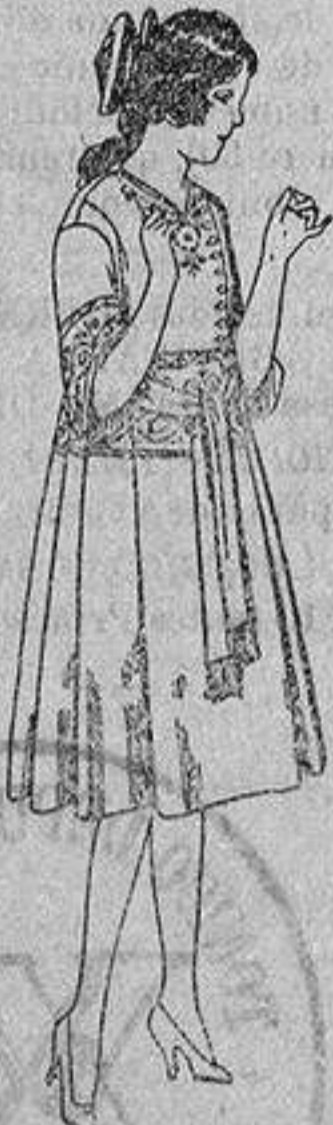
Vestidos de sarga inglesa azul, bordados, para jovencitas de 12 a 15 años, de ptas. 42 a 46.

Gamiseria - Géneros de punto Corbatería - Guantería Sombrerería - Zapatería Paraguas - Bastones y artículos de viaje