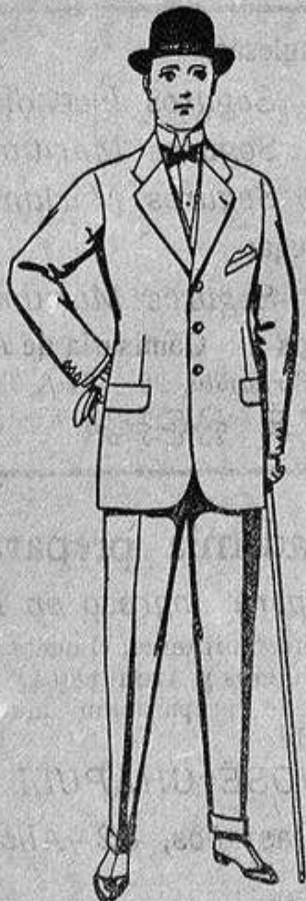
Traje de creviot, melton, etcétera, de ptas. 25 a 85. Los mismos en vicuña o jerga, de p-tas 30 a 90.

Madrid, Barcelona, Alicante, Almería, Bilbao, Cádiz, Cartagena, Gijón, Granada, Málaga, Palma de Mallorca, Santander, Sevilla, Valencia, Valladolid y Zaragoza.