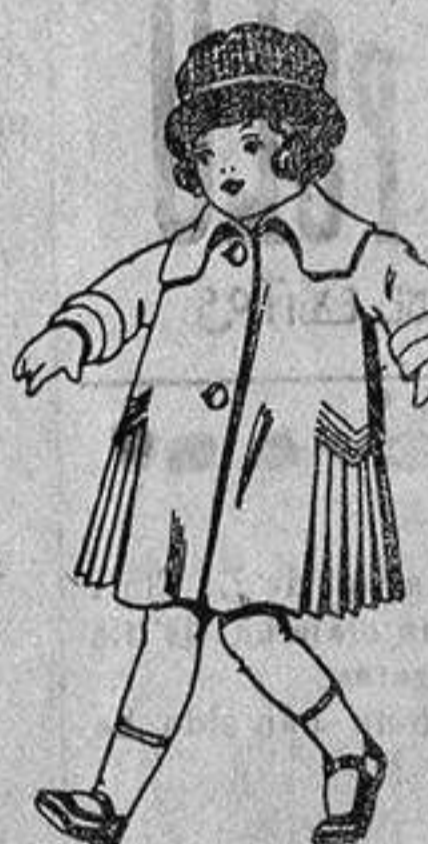
Abrigos de pañete, gamuzas, etc., para niños de 4 a 9 años, de ptas. 24 a 36.