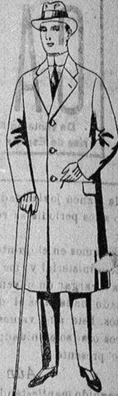
Gabanes de tejido pluma o cheviot, de ptas. 35 a 110.