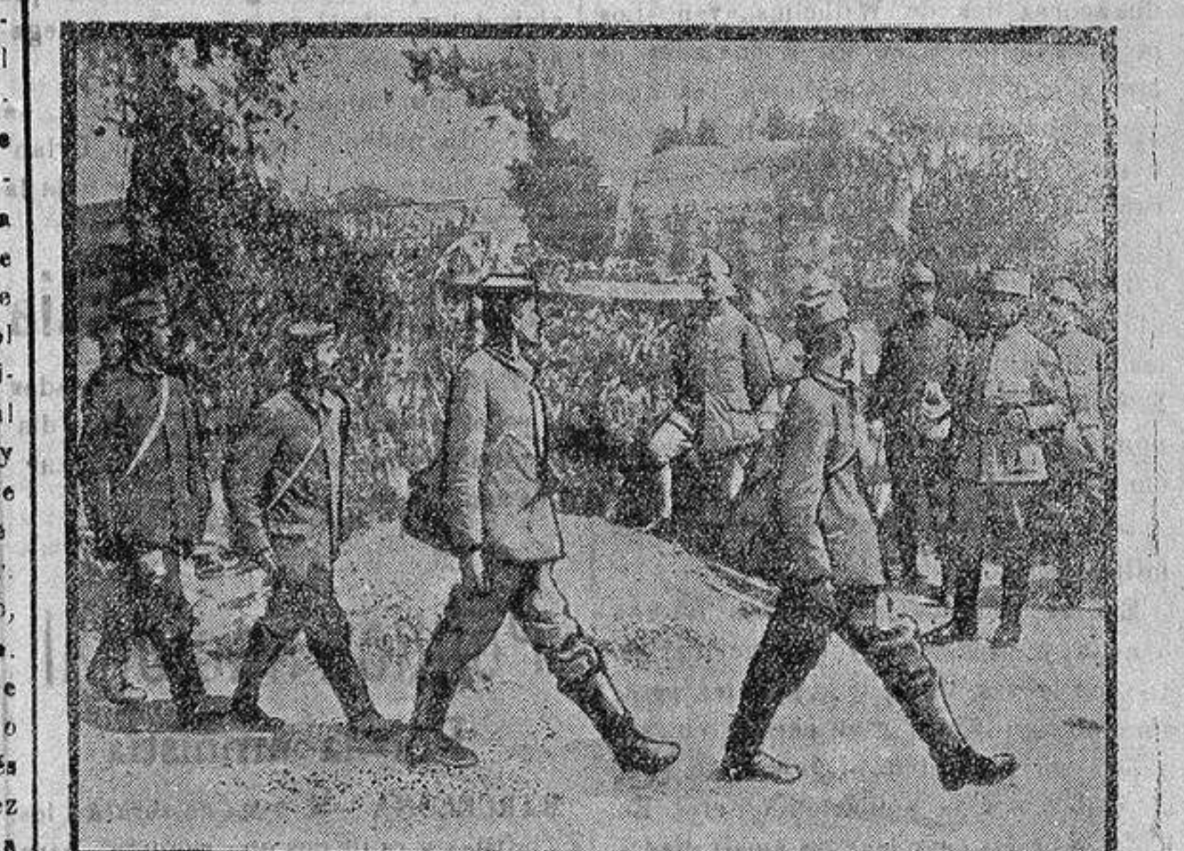
Prisioneros alemanes desfilando ante el general Mathien