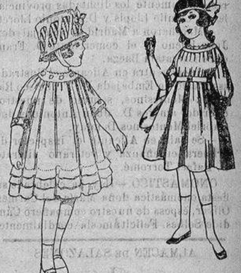
Vestido de gабardina blanca, azul y colores. De ptas. 7 a 10. Vestidos de voile con bordados. De ptas. 18 a 25.