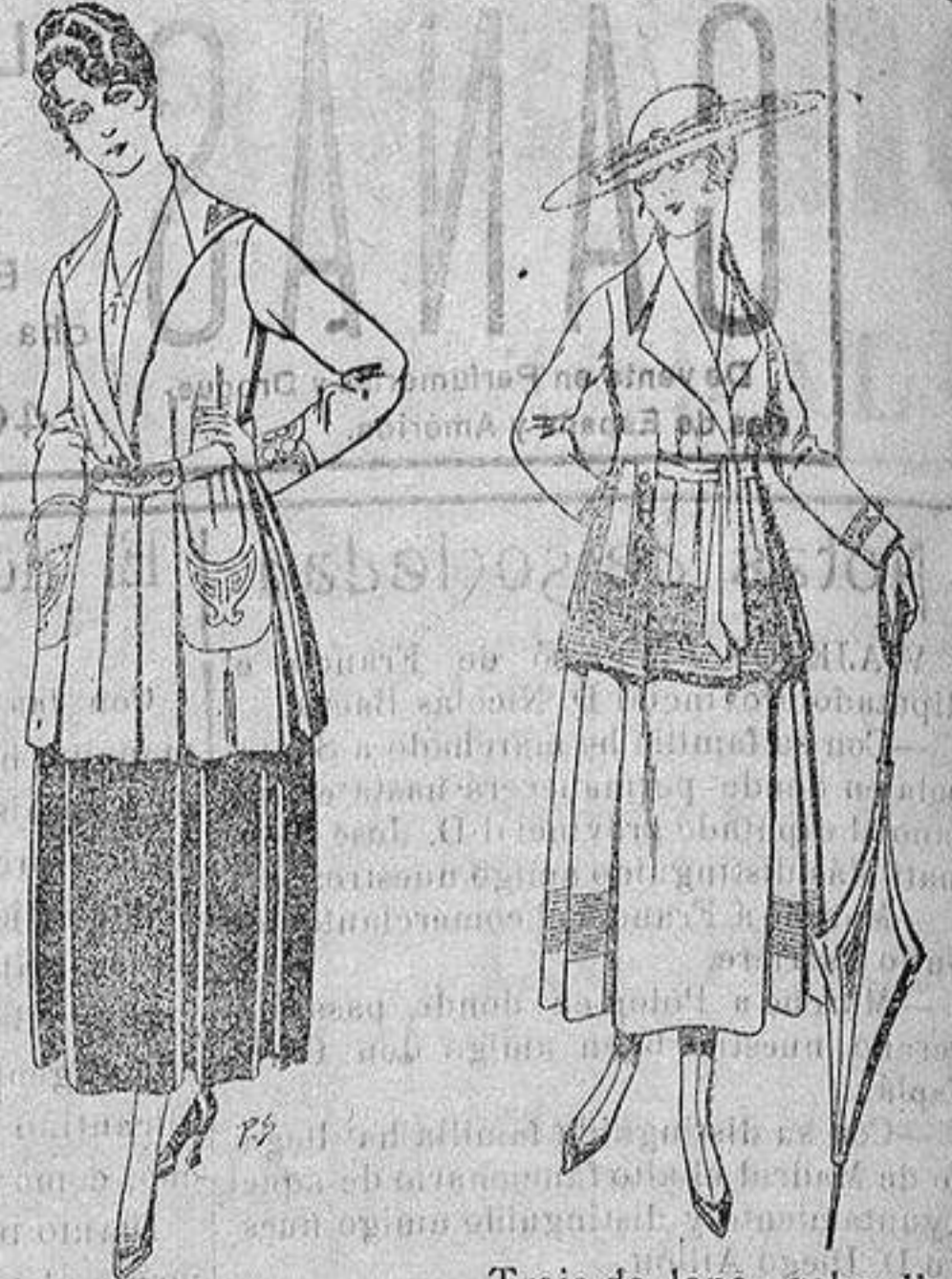
Paletot de tricot de seda o lana. De ptas. 14 a 57. Traje de lana, gabardina negra, azul y color, diferentes bordados. De ptas. 8'50 a 90.

Ropas confeccionadas para Caballero Señora, Niño y Niña