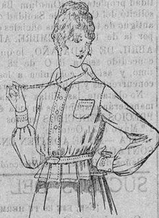
Blusa batista blanca, cuello con calados. A ptas. 4'50.

Camisería, Cóneros de Punto, Corbatería, Guantería, Sombrerería, Zapatería, Bastones, Paraguas y Artículos de Viaje