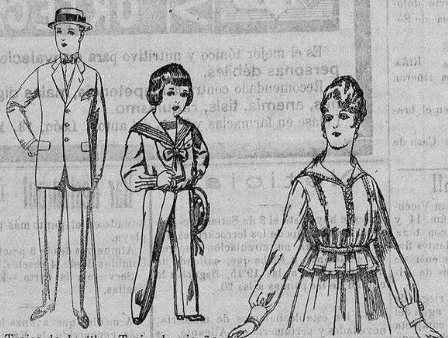
Trajes de lanilla, vicuña, etc., para jovencitos de 10 a 17 años. De ptas. 17 a 50. Traje de vicuña ó jerga azul y negra, para niños de 4 a 9 años. De ptas. 7'50 a 22. Blusa voile en blanco y negro. De ptas. 5'56 a 7.

Ropas confeccionadas para Caballero Señora, Niño y Niña