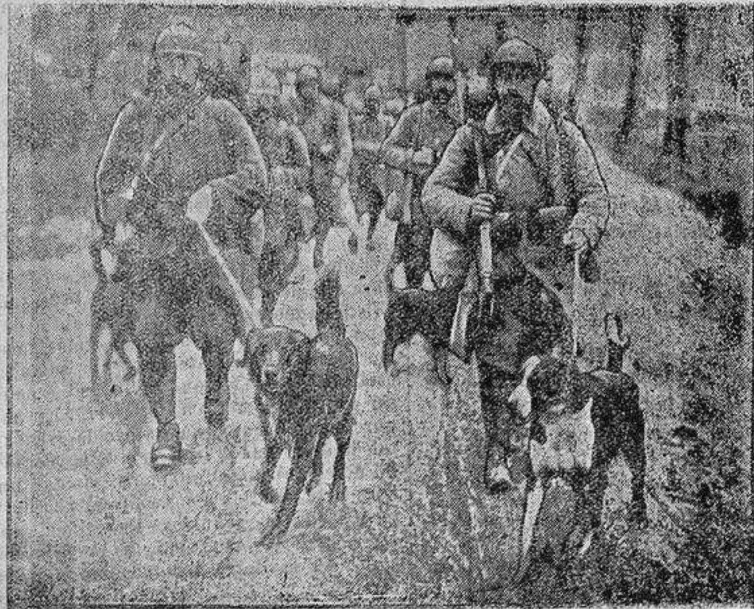
PERROS DE GUERRA