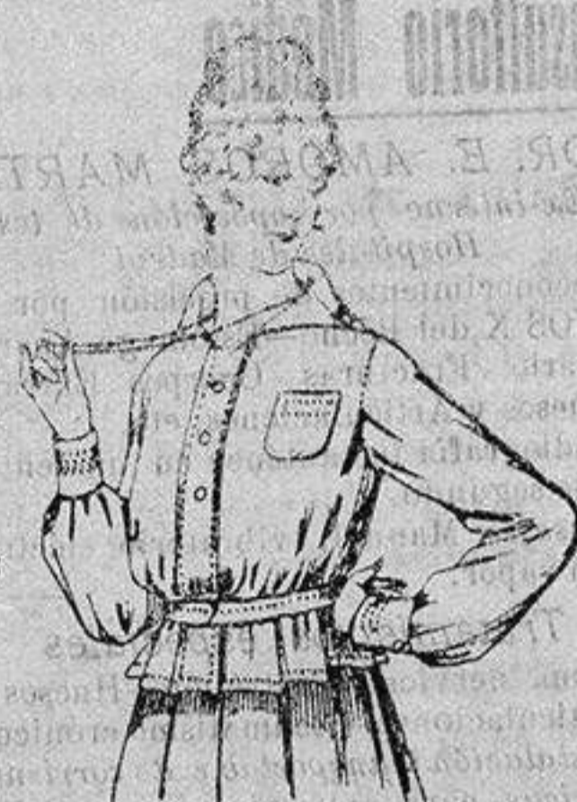
Blusa batista blanca, cuello con calados. A ptas. 4.50.

Camisería, Cóneros de Punto, Corbatería, Guantería, Sombrerería, Zapatería, Bastones, Paraguas y Artículos de Viaje