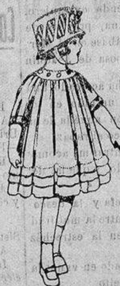
Vestidos de voile blanco, con bordados. De ptas. 7 a 10.