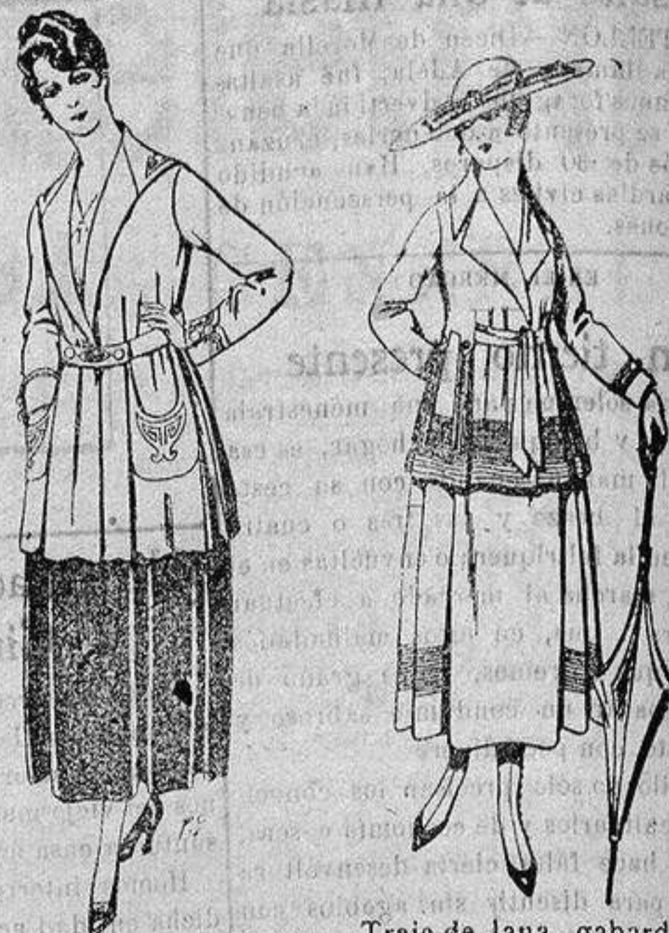
Paletot de tricot de seda o lana. De ptas. 14 a 57.