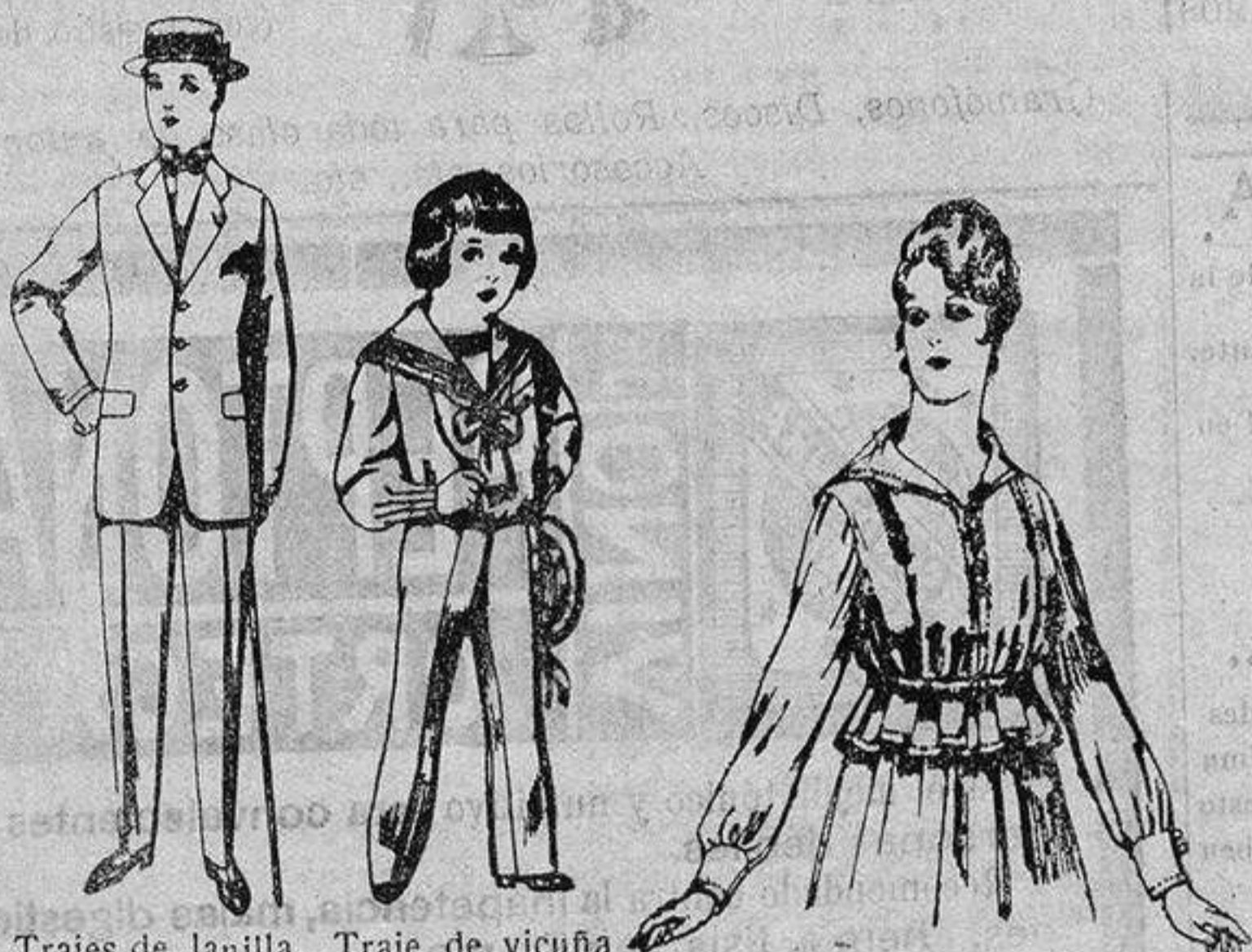
Trajes de lanilla, vicuña, etc., para jovencitos de 10 a 17 años. De ptas. 17 a 50.