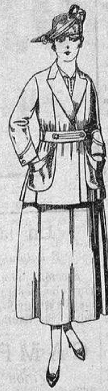
Traje de estambre negro, azul y color. de ptas. 70 a 75