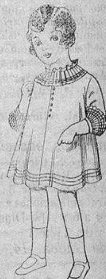
Vestido de voile blanco bordado. De ptas. 6'75 a 8