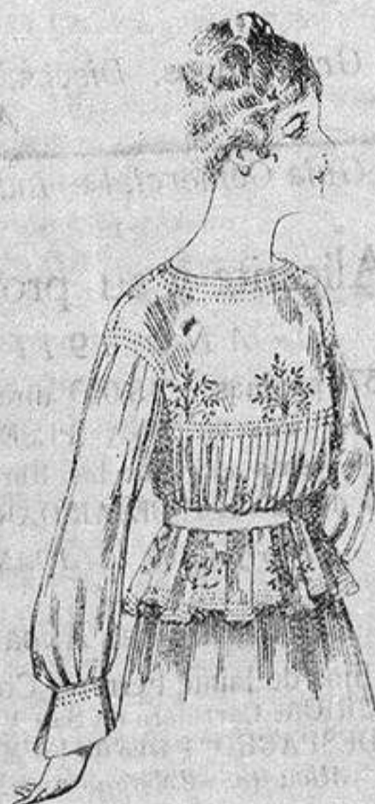
Blusa de crespón o seda, en negro, azul y color. de ptas. 33 a 35

Ropas confeccionadas para Caballero Señora, Niño y Niña