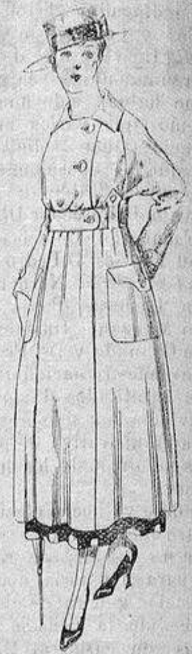
Guardapolvo de dril beige manga Ragland. a ptas. 23