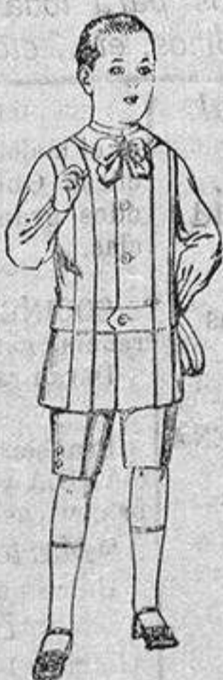
Traje de lanilla, para niños de 4 a 9 años. de ptas. 12 a 31