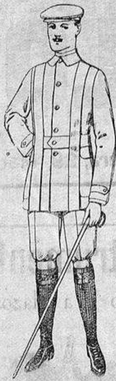
Cazadoras de dril crudo o kaki. De ptas. 12 a 20. Pantalones cortos para sportman, de dril beige. De ptas. 8 a 12