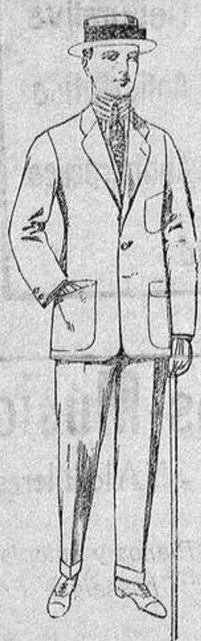
Traje de dril crudo, kaki o listado. De ptas. 10 a 38

Madrid, Barcelona, Alicante, Almería, Bilbao, Cádiz, Cartagena, Gijón, Granada, Málaga, Palma de Mallorca, Santander, Sevilla, Valencia, Valladolid y Zaragoza.