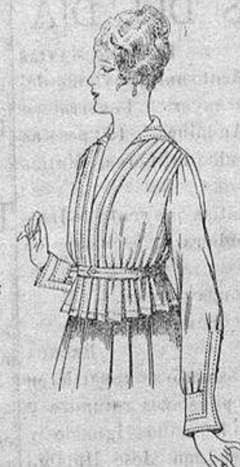
Blusa batista blanca A ptas. 5'75

Gamisería, Géneros de Punto, Gorbatería, Guantería, Sombrerería, Zapatería, Bastones, Paraguas y Artículos de Viaje