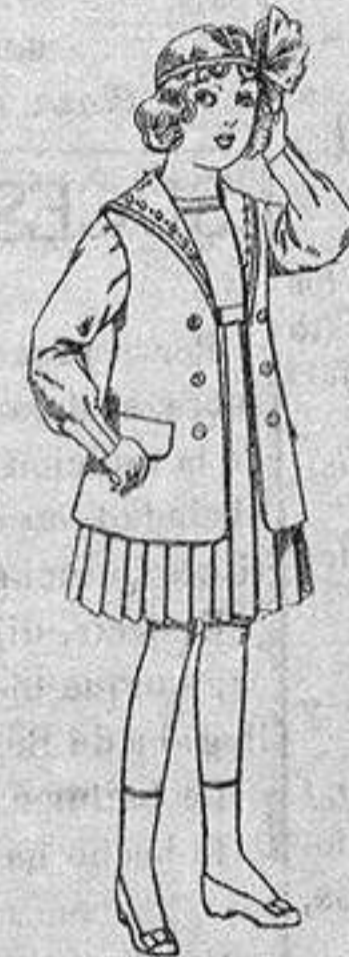
Traje de gabardina blanco, cuello de organdín bordado, para niñas de 4 a 9 años. De ptas. 22 a 24