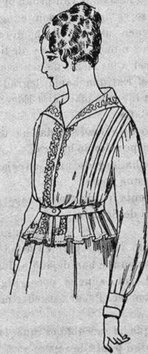
Blusa de voile blanco, bordados blanco, rosa o azul. A ptas. 9

Gamisería, Géneros de Punto, Corbatería, Guantería, Sombrerería, Zapatería, Bastones, Paraguas y Artículos de Viaje