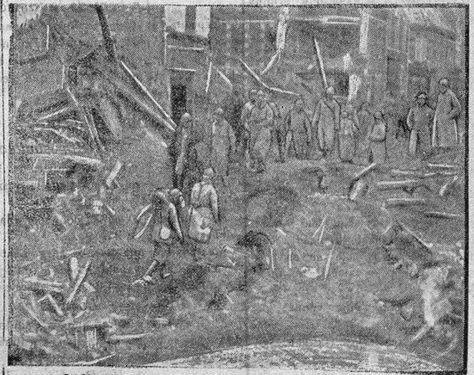
Galle de un pueblo francés destruida por los alemanes en su retirada