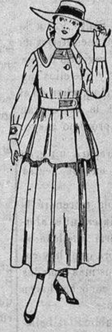
Trajes de lanilla negra, azul y color, para jovencitas de 13 a 16 años. De ptas. 50 a 55