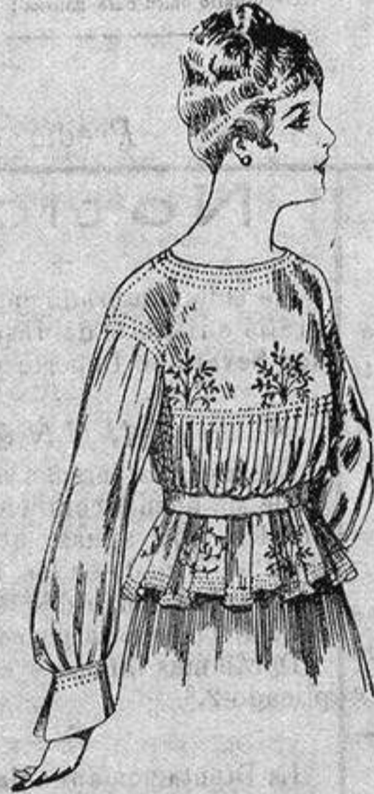
Blusa de crespón o seda, en negro, azul y color. A ptas. 33

Ropas confeccionadas para Caballero Señora, Niño y Niña