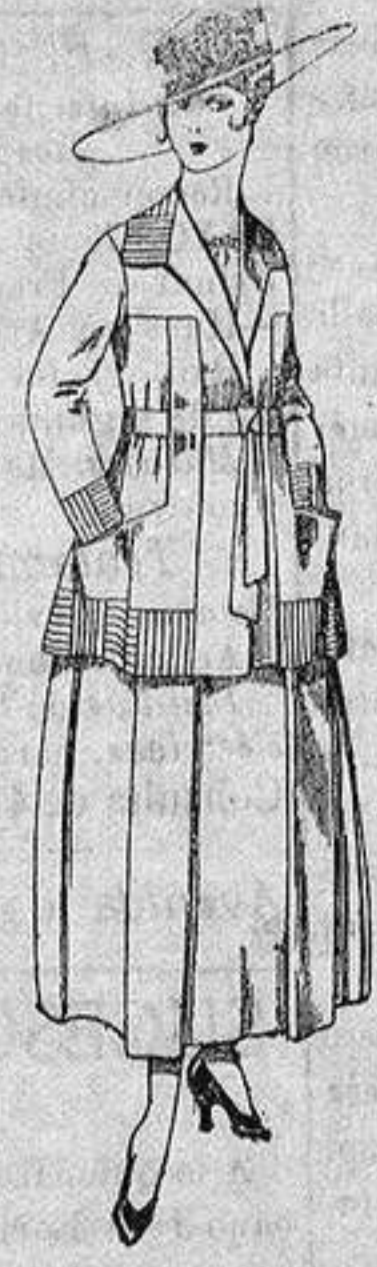
Traje lanilla negra, azul y color, bordado a ptas. 90

Madrid, Barcelona, Alicante, Almería, Bilbao, Cádiz, Cartagena, Gijón, Granada, Málaga, Palma de Mallorca, Santander, Sevilla, Valencia, Valladolid y Zaragoza.