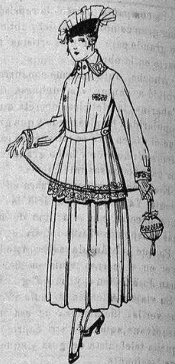
Traje de estambre, negro azul y color bordado. de ptas. 90 a 93