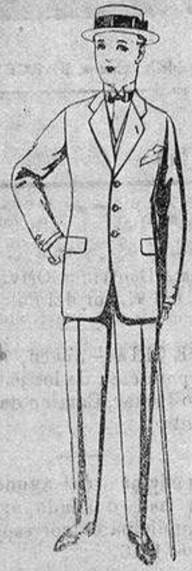
Trajes de lanilla, vicuña, etc., para jovencitos de 10 a 16 años. de ptas. 19 a 56.