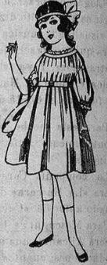
Vestidos de lanilla azul, para niñas de 4 a 9 años. De ptas. 22 a 25. Los mismos en voile De ptas. 10 a 17.