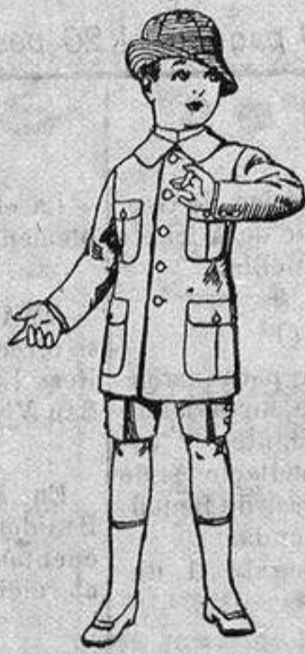
Trajes de lanilla, melton, etc., para niños de 4 a 9 años. de ptas. 16 a 33