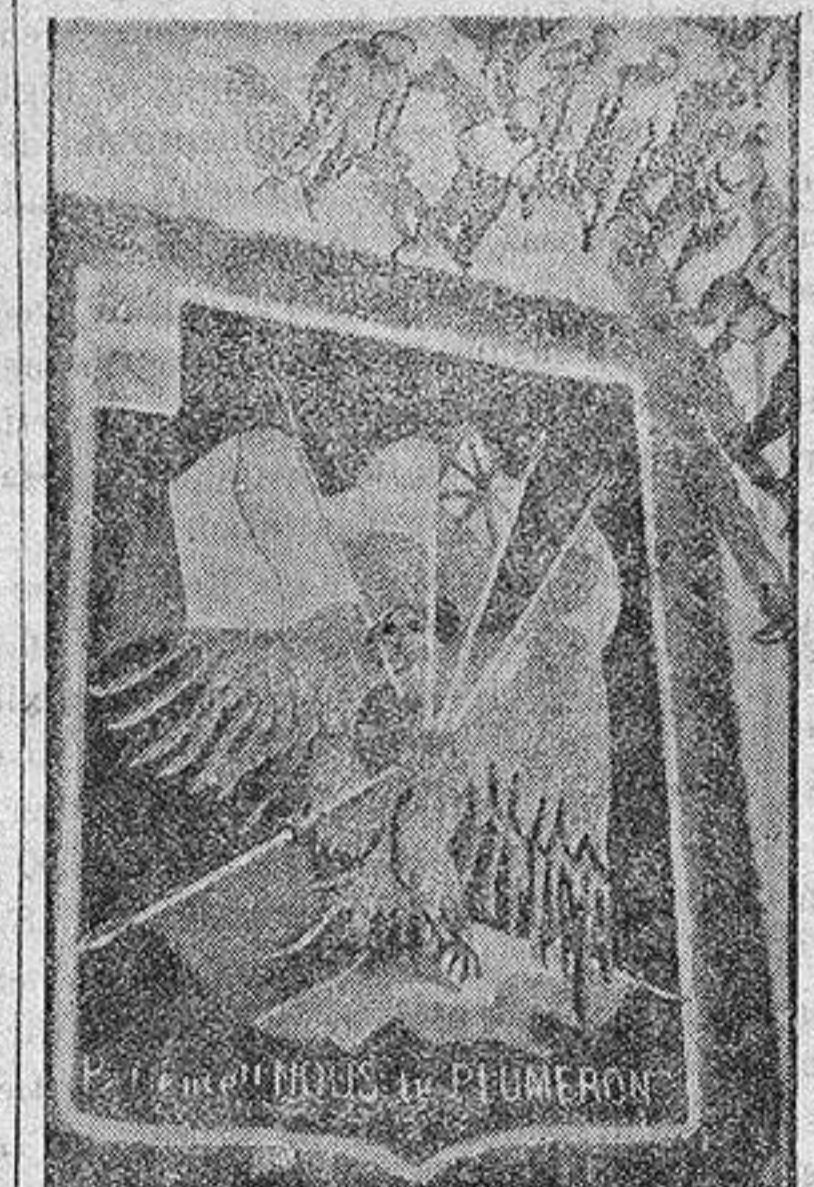
FIESTA DE AVIACION