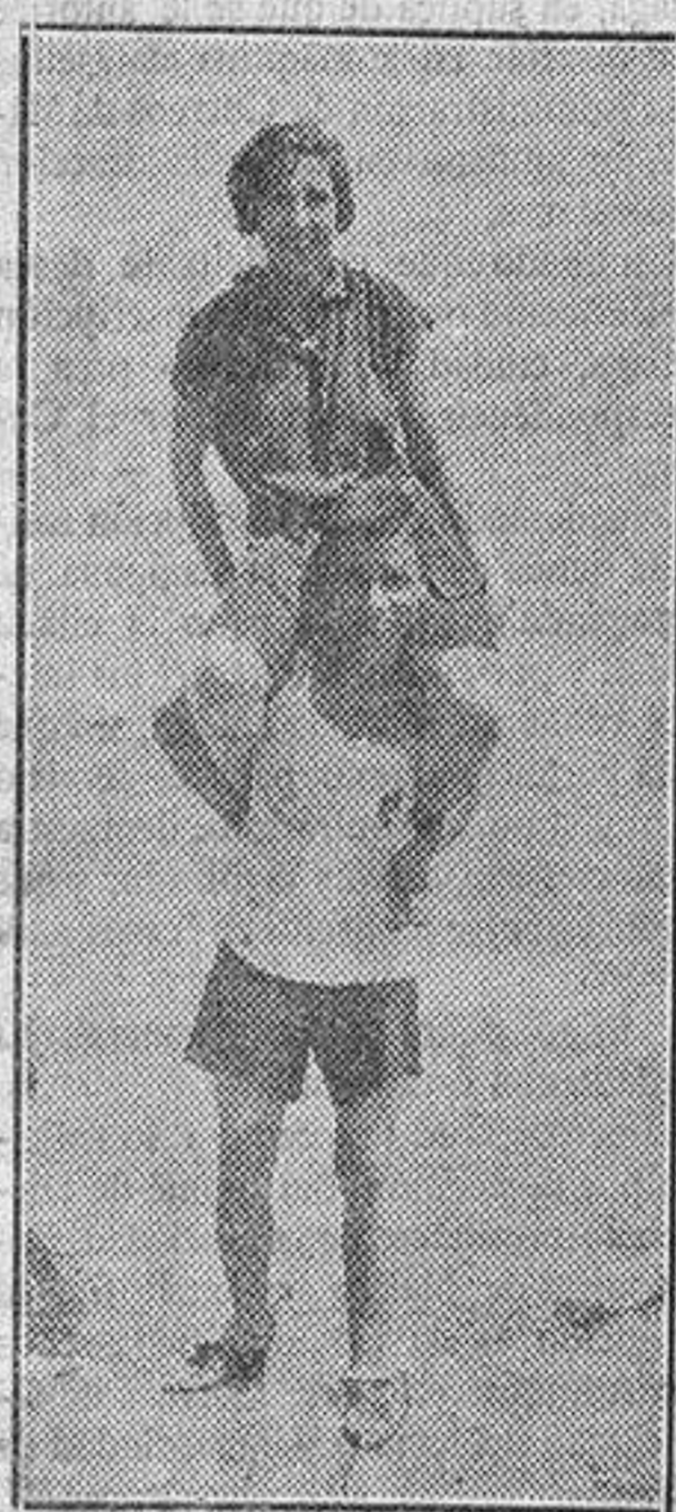
No solamente sabe andar nuestro «Meló». También se recrea en los ratos libres y extrae del agua lindas muchachitas

tengo bastante para atender las exigencias de mi estómago.