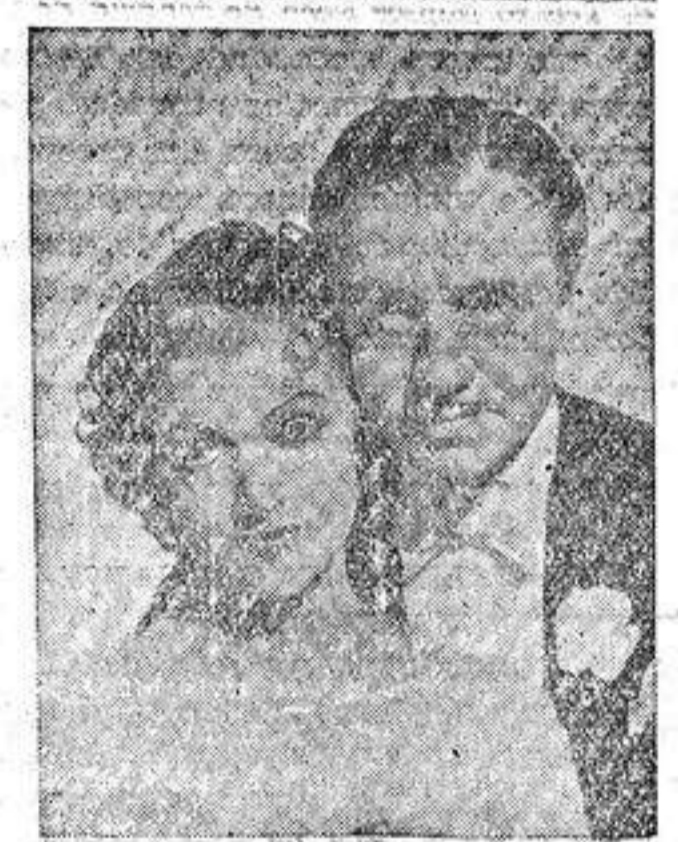
EN UNA ESCENA DE «EL GRAN ZIEGFELD»

Los cuadros en la revista son una sucesión de tópicos usados. Vistos una y otra vez. Sumamente difícil es llegar a una originalidad que el público debido al abuso tampoco pretende hallar. Sombbrero de Copa la obra estrenada en el Astoria y presentada al público de Barcelona contiene unos planos arrebatados que poseen la más perfecta belleza interpretativa en la forma y en su estilo. «Sombbrero de copa» film que por el hecho de ser protagonizado por la insuperable pareja Rogers Astaire reuniría los atractivos máximos tiene aún ese cuadro espectacular admirable, titulado «Top hat», en el que vemos a Fred Astaire centralizando la acción nauta a los componentes del conjunto integrado por boys en una maravilla de plástica y estética. El baile revista donde se mueve Fred Astaire sobre ese fondo estilizado de personalidad única y de carácter definido es el momento su-