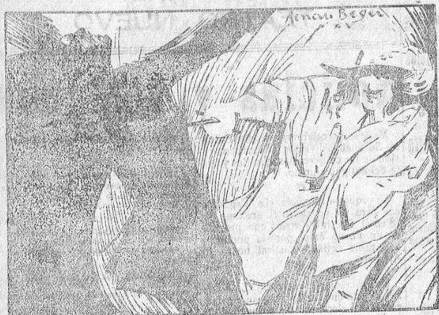
Sólo a traición podía herirse al DUQUE DE NEVERS, el poseedor del secreto de aquella estocada imparable que se hizo famosa en el mundo con el nombre de LA ESTOCADA DE NEVERS

EL CLIMA DE ALICANTE Gran día el de hoy. Ha vuelto a subir el termómetro. El sol ha sido de verano, pero de verano esplendoroso. La temperatura máxima fué de 28 grados. La mínima a la sombra de seis.