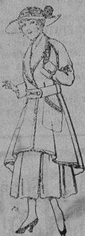
Abrigos de patén para jovencitas de 13 a 16 años De ptas. 25 a 35