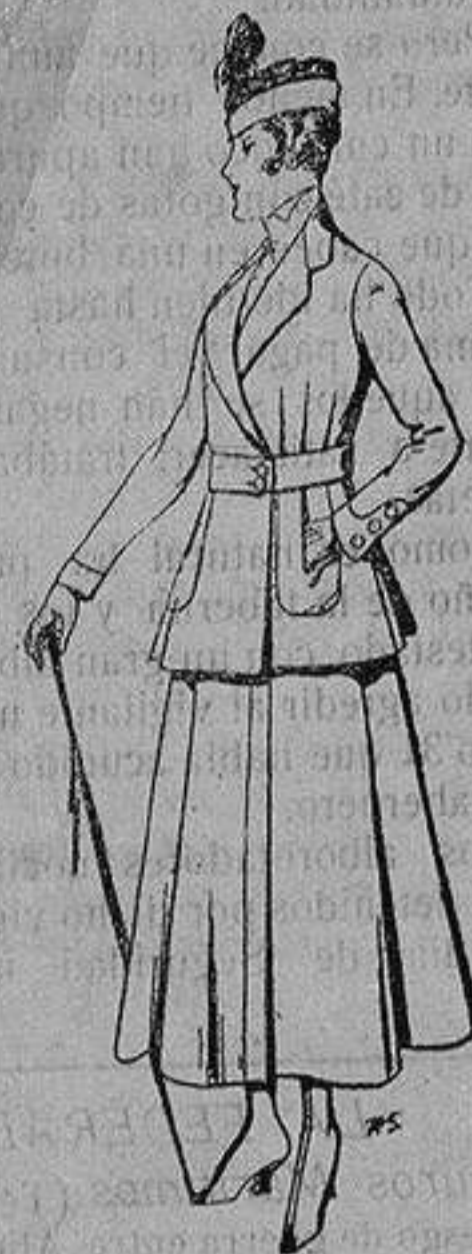
Trajes de lana negra azul y color, para señora De ptas. 50 a 55

Ropas confeccionadas para Caballero, Señora, Niño y Niña