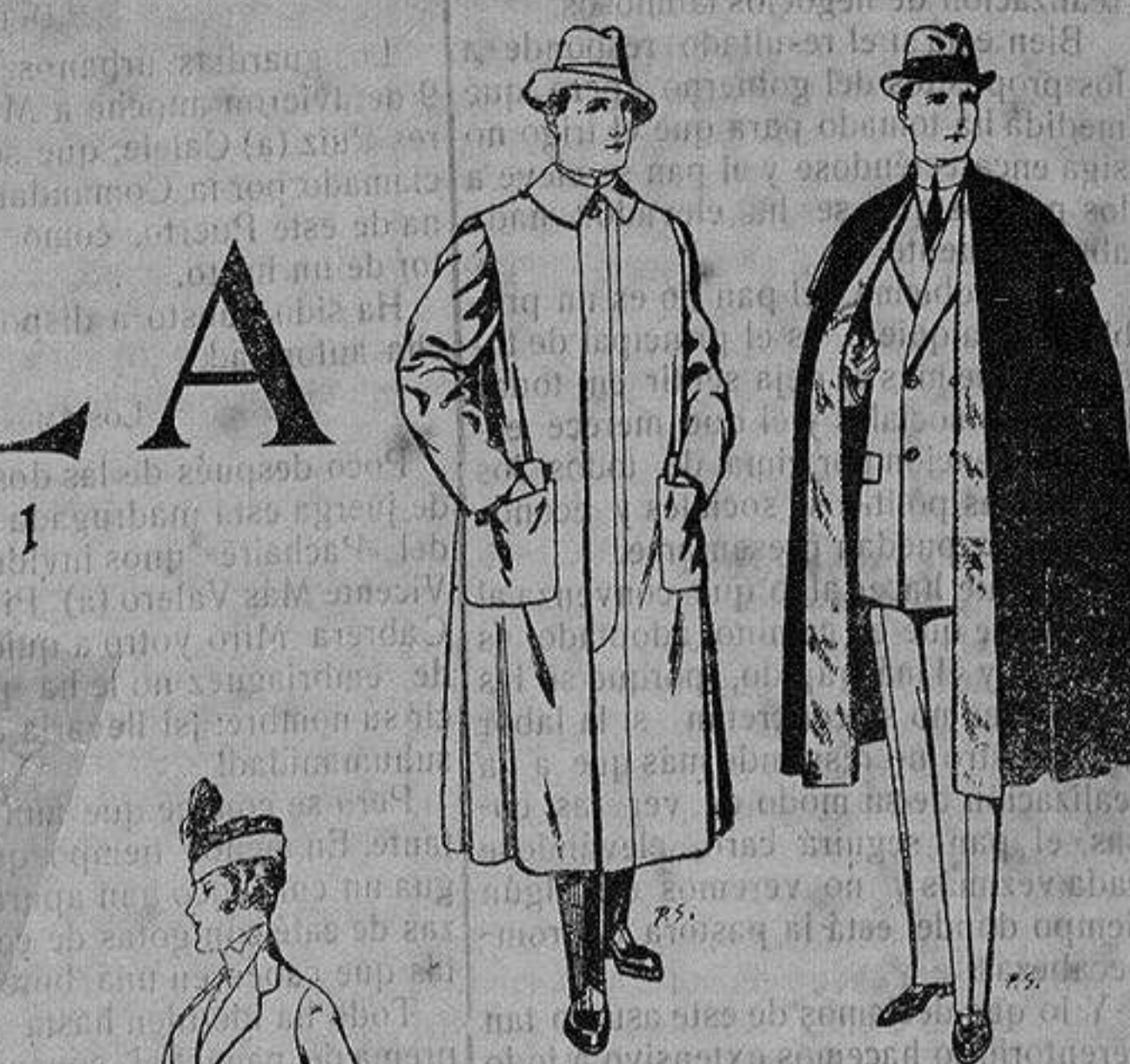
Impermeables forma gabán en color beige o gris De ptas. 35 a 100