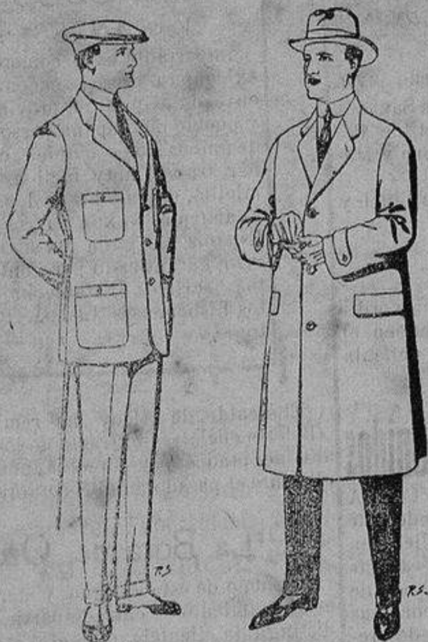
Trajes de cheviot corte elegante para "Sportman" De 35 a 50 ptas.

Madrid, Barcelona, Alicante, Almería, Bilbao, Cádiz, Cartagena, Gijón, Granada, Málaga, Palma de Mallorca, Santander, Sevilla, Valencia, Valladolid y Zaragoza