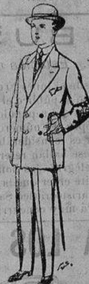
Trajes de patén, vicuña, etc., para niños de 10 a 16 años De ptas. 25 a 48