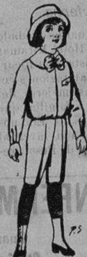
Trajes de patén para niños de 4 a 9 años De ptas. 5 a 7'50