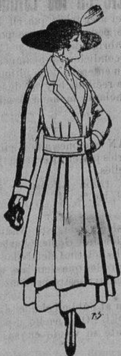
Abrigos de patén gran novedad para señora A ptas. 53