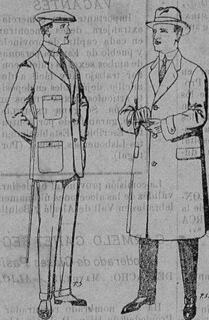
Trajes de cheviot corte elegante para "Sportman" De 35 a 50 ptas. Gabanes de tejido pluma o satina De ptas. 30 a 100

Peletería, Camisería, Generos de Punto, Corbatería, Guantería, Sombrerería, Zapatería, Paraguas, Bastones y Artículos de Viaje.