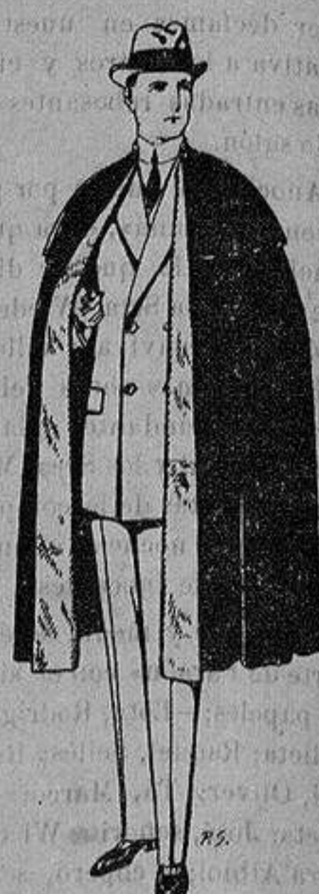
Capas (enteras) de paño De ptas. 25 a 100