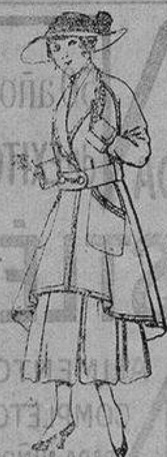
Abrigos de patén para jovencitas de 13 a 16 años De ptas. 25 a 35