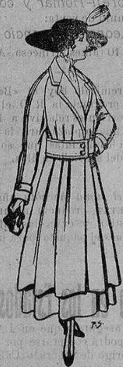
Abrigos de patén gran novedad para señora A ptas. 53