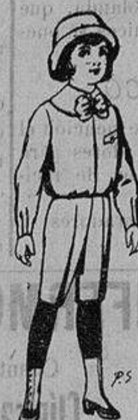
Trajes de patén para niños de 4 a 9 años De ptas. 5 a 750