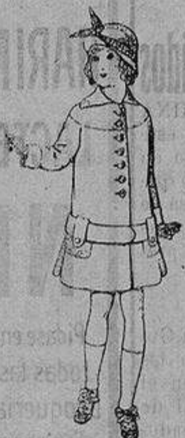
Abrigos de patén para niños de 4 a 12 años De ptas. 15 a 25