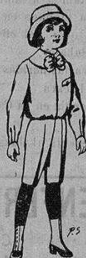
Trajes de patén para niños de 4 a 9 años De ptas. 5 a 7'50