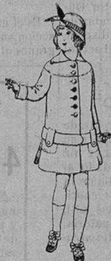
Abrigos de patén para niños de 4 a 12 años De ptas. 15 a 25