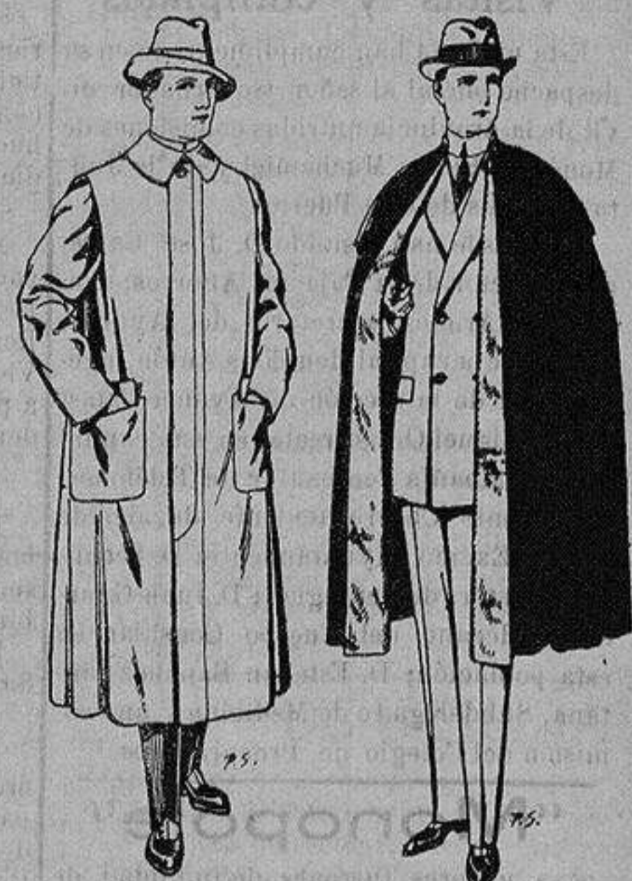
Impermeables forma gabán en color beige o gris De ptas. 35 a 100