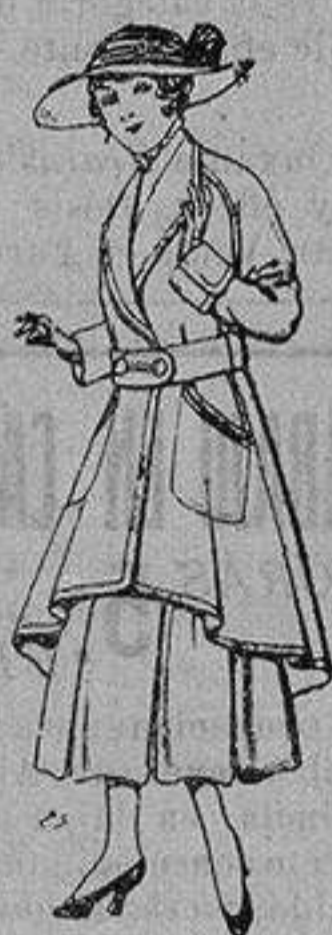
Abrigos de patén para jovencitas de 13 a 16 años De ptas. 25 a 35