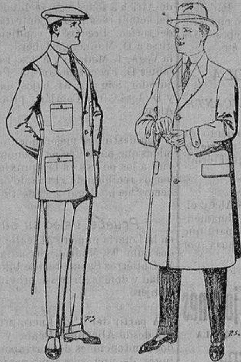
Trajes de cheviot corte elegante para «Sportman» De 35 a 50 ptas

Peletería, Camisería, Generos de Punto, Corbatería, Guantería, Sombrerería, Zapatería, Paraguas, Bastones y Artículos de Viaje.