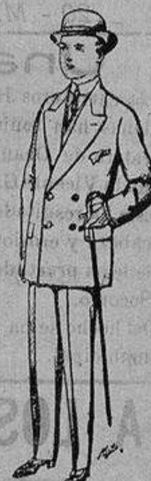
Trajes de patén, vicuña, etc., para niños de 10 a 16 años De ptas. 25 a 48