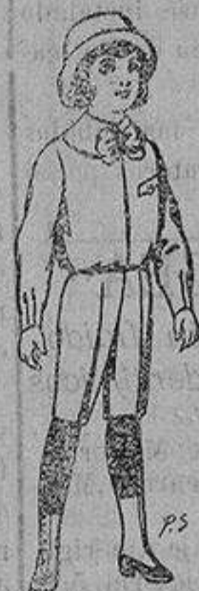
Trajes de patén para niños de 4 a 9 años De ptas. 5 a 7.50