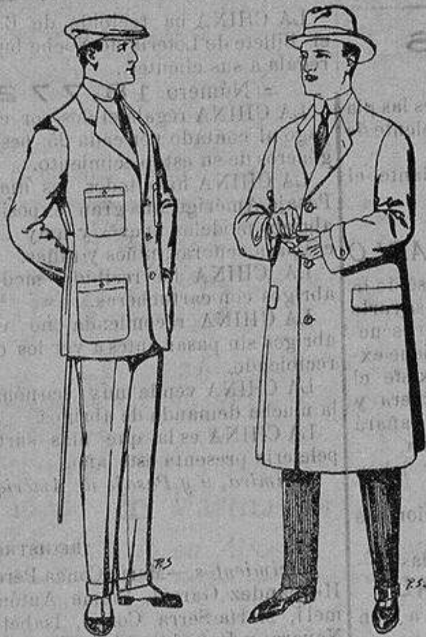
Trajes de cheviot corte elegante para «Sportman» De 35 a 50 ptas. Gabanes de tejido pluma o satina De ptas. 30 a 100

Madrid, Barcelona, Alicante, Almería, Bilbao, Cádiz, Cartagena, Gijón, Granada, Málaga, Palma de Mallorca, Santander, Sevilla, Valencia, Valladolid y Zaragoza