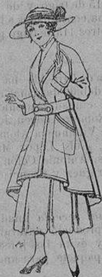
Abrigos de patén para jovencitas de 13 a 16 años De ptas. 25 a 35