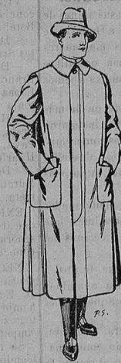
Impermeables forma gabán en color beige o gris De ptas. 35 a 100

Peletería, Camisería, Generos de Punto, Corbatería, Guantería, Sombrerería, Zapatería, Paraguas, Bastones y Artículos de Viaje.