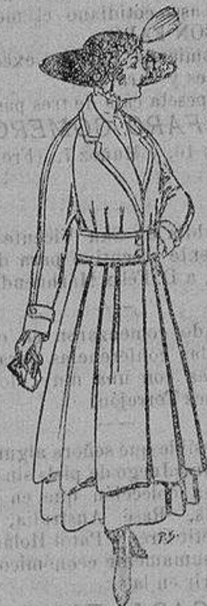
Abrigos de patén gran novedad para señora A ptas. 53