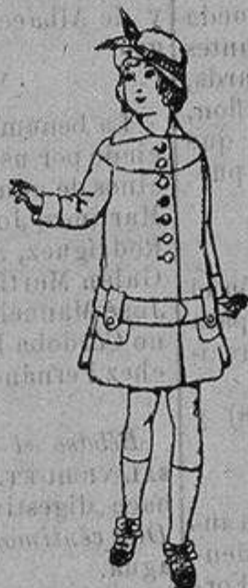
Abrigos de patén para niños de 4 a 12 años De ptas. 15 a 25