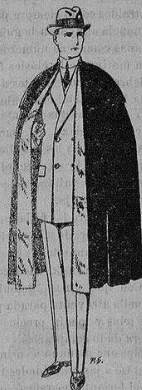
Capas (enteras) de paño De ptas. 25 a 100