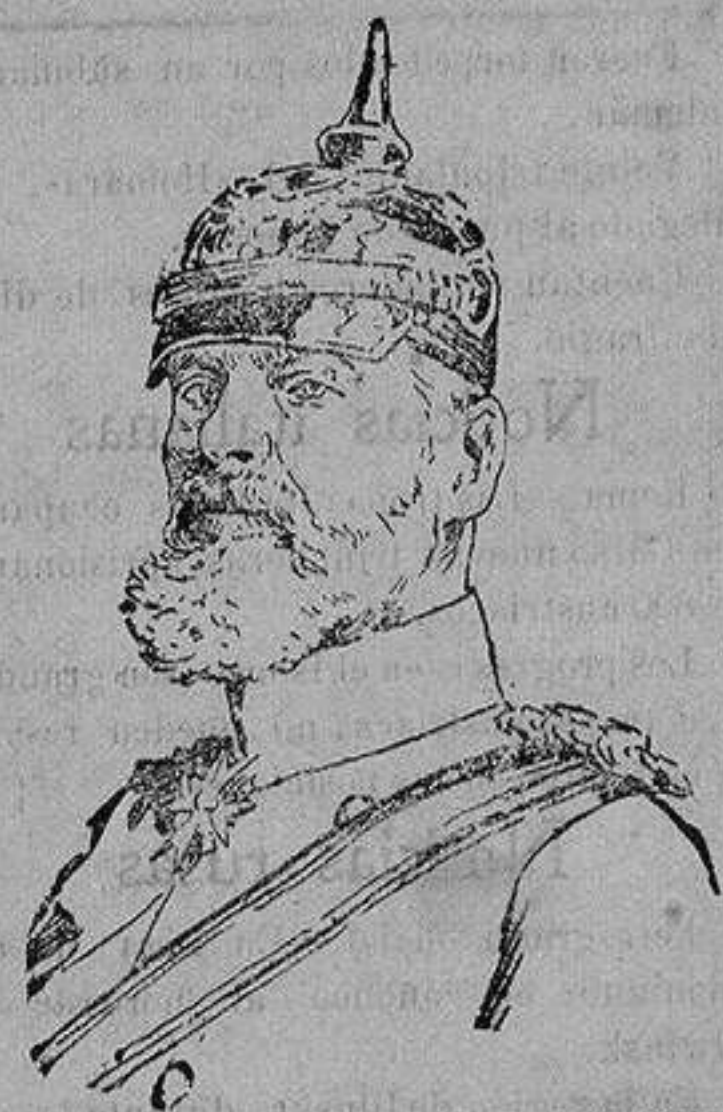
El príncipe LEOPOLDO de BAVIERA, que opera con su ejército en la región de Pinsk