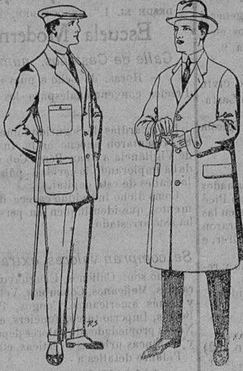
Trajes de cheviot corte elegante para «Sportman» De 35 a 50 ptas Gabanes de tejido pluma o satina De ptas. 30 a 100

Madrid, Barcelona, Alicante, Almeria, Bilbao, Cádiz, Cartagena, Gijón, Granada, Málaga, Palma de Mallorca, Santander, Sevilla, Valencia, Valladolid y Zaragoza