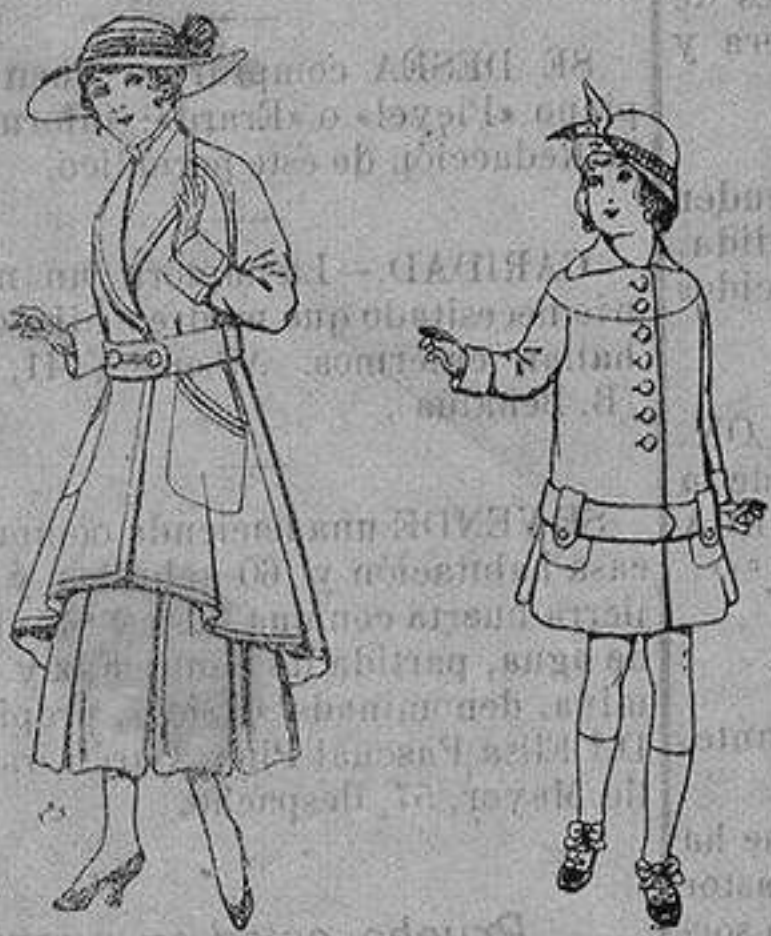
Abrigos de patén gran novedad para señora A ptas. 53 Abrigos de patén para niños de 4 a 12 años De ptas. 15 a 25