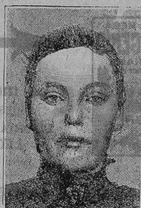
Antes de la curacion