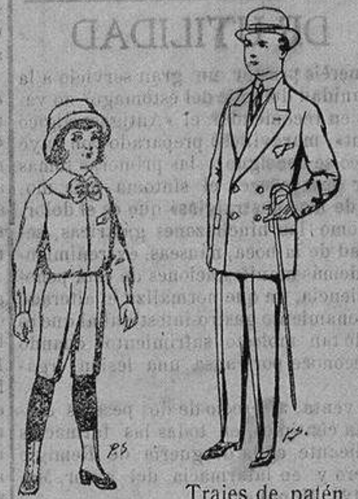
Trajes de patén vicuña, etc., para niños de 4 a 16 años De ptas. 5 a 7'50 Trajes de patén, para niños de 10 a 16 años De ptas. 25 a 48