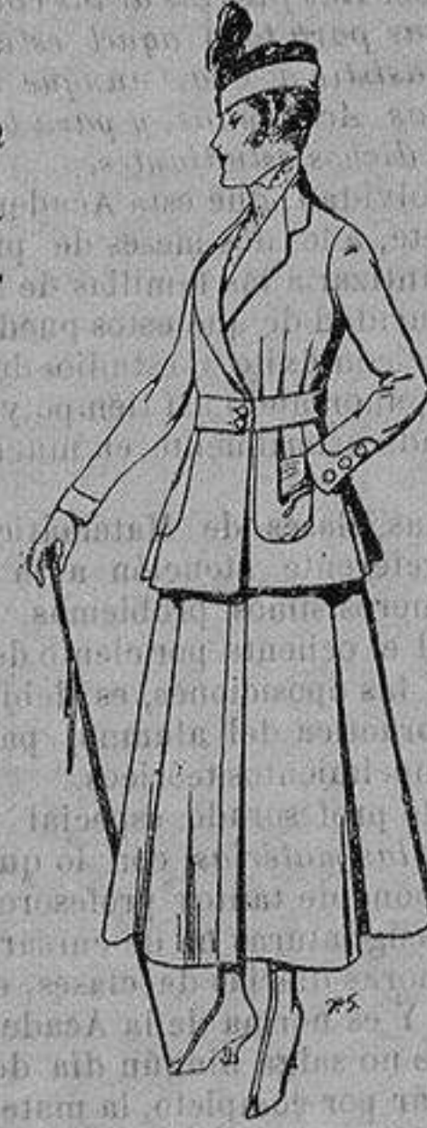
Trajes de lana negra azul y color, para señora De ptas. 50 a 55