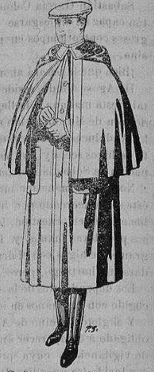
Gabanes de lana vigonia o melton, para niños de 10 a 16 años De ptas. 20 a 56