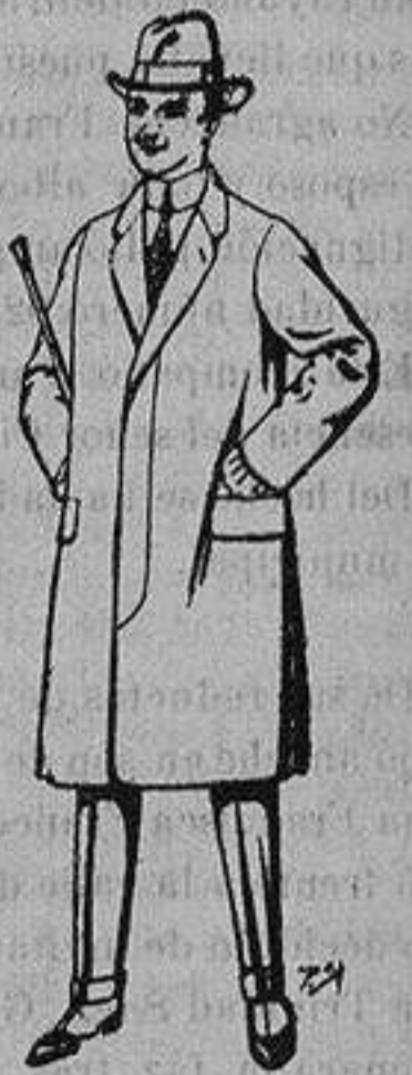
Gabanes de lana vigonia o melton, para niños de 10 a 16 años