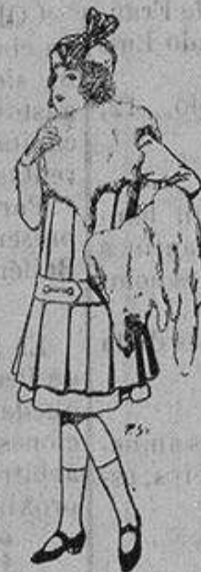
Juego de pieles para niñas A ptas. 15