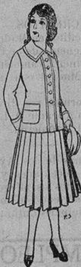
Paletof de lana para jovencitas de 13 a 16 años De 12'50 a 20 ptas