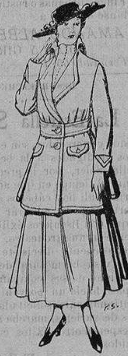
Abrigos de patén gran novedad para señora De 26 a 40 ptas.