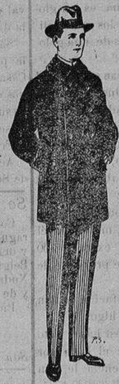
Pelizas con cuello y bocamangas astrakan De 14 a 90 ptas.