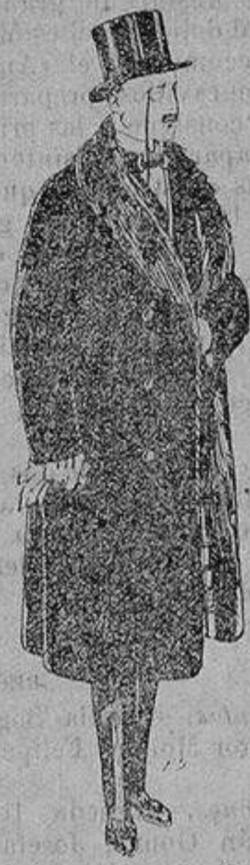
Gabanes de edredón negro, forro seda, cuello y vistas de piel De 125 y 135 ptas

Peletería, Camisería, Generos de Punto, Corbatería, Guantería, Sombrerería, Zapatería, Paraguas, Bastones y Artículos de Viaje.