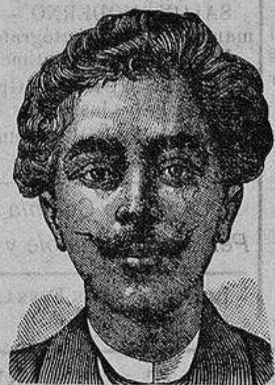
Antes de la curacion